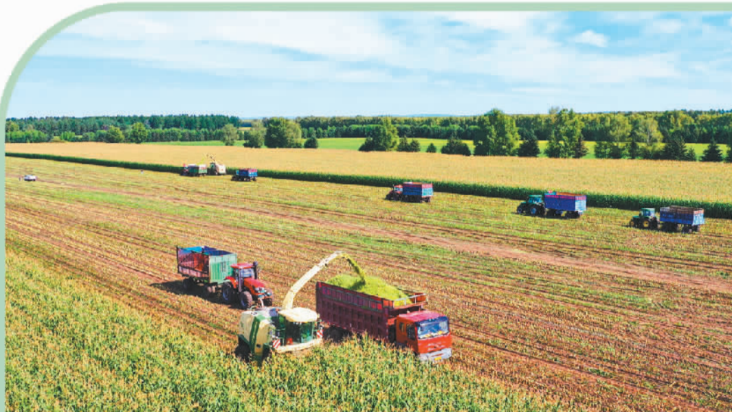
北大荒集团格球山农场有限公司第二作业区，一块玉米饲料地集中多台机械收获青贮玉米饲料。