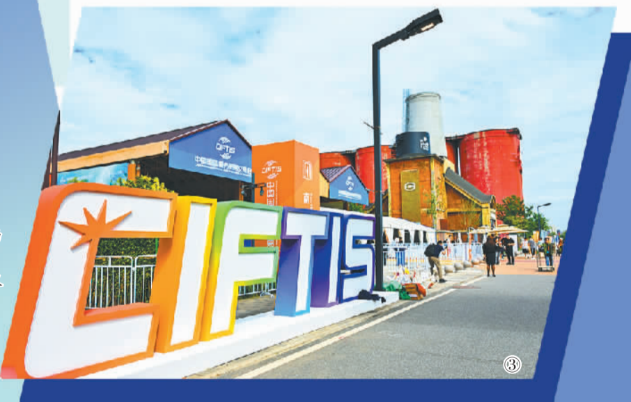
图③ 2024年服贸会首钢园展区。