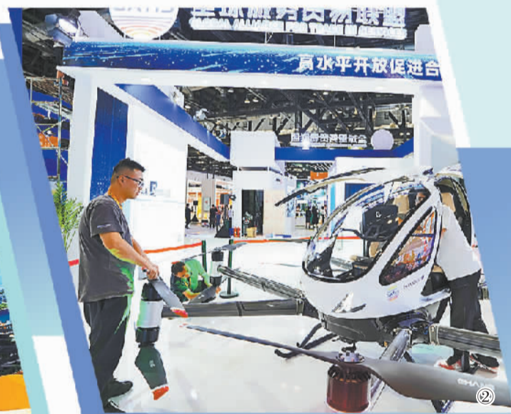
图② 工作人员在2024年服贸会国家会议中心会场全球服务贸易联盟展台调试无人机。