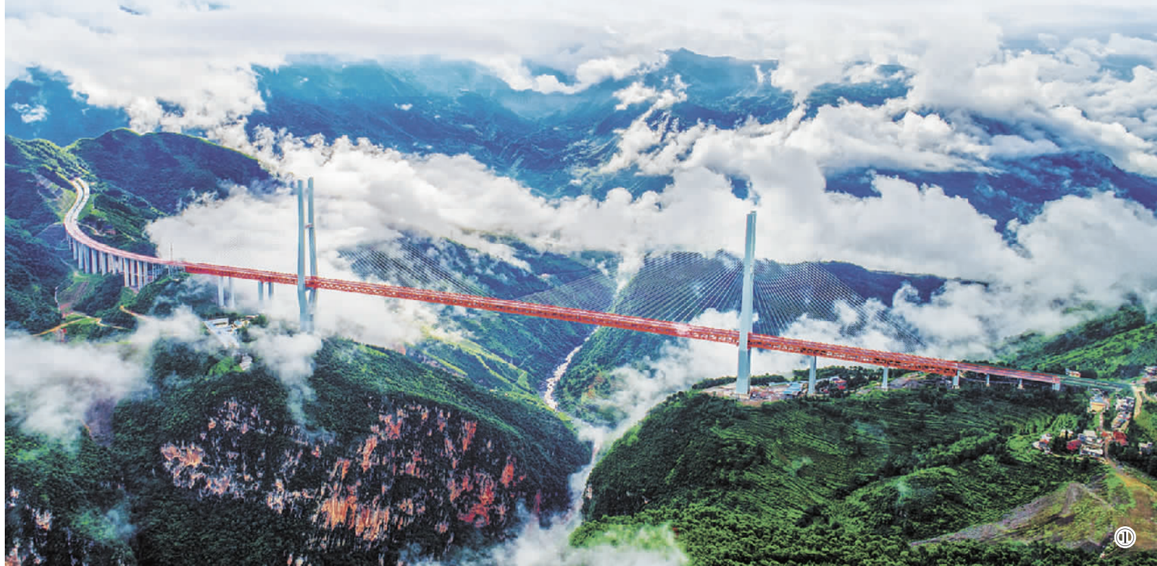
①2016年12月29日，杭瑞高速公路毕节至都格高速公路北盘江大桥正式通车。该桥桥梁主跨720米，桥面距水面565米，2018年9月经吉尼斯世界纪录认证为“世界最高桥”。