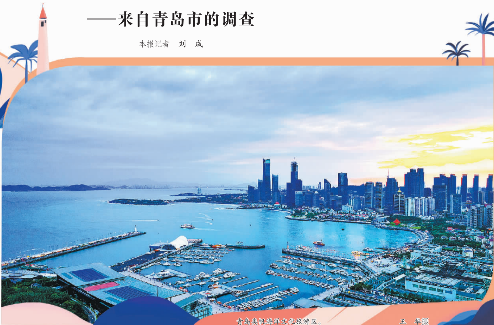
青岛奥帆海洋文化旅游区。