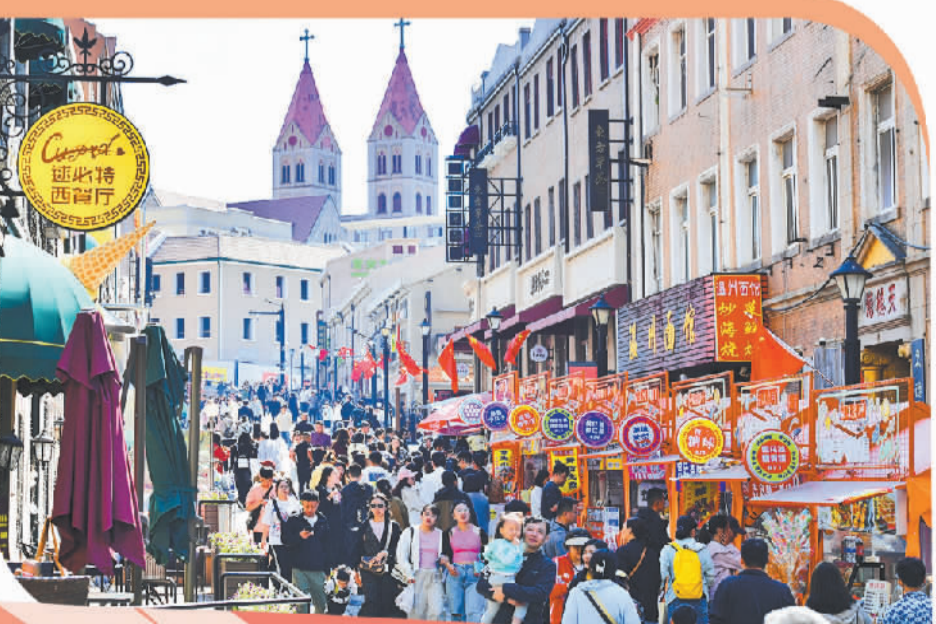
今年国庆假期，青岛市市北区大鲍岛文化休闲街区迎来众多游客。

在奥帆中心海上剧场，《寻梦沧海》正在上演。借助沉浸式声光电技术、动感座椅等，观众可以身临其境地