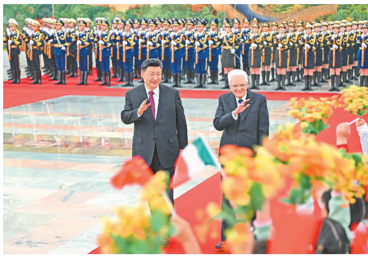
国家主席习近平在北京人民大会堂同来华进行国事访问的意大利总统马塔雷拉举行会谈。

新华社北京11月8日电(记者董雪、冯歆然)11月8日下午,国家主席习近平在北京人民大会堂同来华进行国事访问的意大利总统马塔雷拉举行会谈。 习近平指出,今年是中意建立全面战略伙伴关系20周年。双方发表了加强全面战略伙伴关系的行动计划,推动双边关系进入发展新阶段。当今世界正在经历百年未有之大变局,中国和意大利作为两大文明古国,应该弘扬开放包容、兼容并蓄的传统,推动国际社会以对话化解分歧、以合作超越冲突,携手构建和合共生的美好世界。 习近平强调,互尊互信、互利共赢应该始终成为中意关系最鲜明的底色。双方应该充分发挥中意政府委员会和各领域对话机制作用,加强交往,夯实互信,继续理解和支持彼此核心利益和重大关切,做相互支持的战略伙伴。中意文化合作富有成果和活力,双方要继续密切人文交流,落实好新一轮文化合作执行计划,深化文化艺术、文物保护、经典著作互译、旅游、教育等领域合作,将文化遗产地合作打造为中意人文交流新亮点。 双方要支持语言教学和青少年交流,共同培育更多新时代的马可·波罗。双方要坚持做相互成就的合作伙伴。中方愿扩大进口意大利优质产品,支持两国企业相互投资,继续推进科技环保、清洁能源、航天等领域合作。 习近平指出,当今世界正在经历深刻变化,中欧作为两大和平、建设性力量,坚持战略沟通、开放合作、交流互鉴的正确方向,有利于双方,有利于世界。中国将欧洲作为实现中国现代化的重要伙伴,双方应该坚持合作共赢,妥善管控分歧,让中欧关系展现应有的成熟和稳定。中方愿同欧方加强合作应对全球性挑战,希望意方为此发挥积极作用。 马塔雷拉表示,我对2017年访华以及2019年接待习近平主席访意的情景记忆犹新。今年是马可·波罗逝世700周年,马可·波罗同中国的渊源是意中友好源远流长、两大文明交相辉映的缩影。当今世界正在经历深刻演变,人类社会需要加强团结互助,实现和谐共处。意中应该进一步深化文化、教育、语言教学、遗产地结好等人文领域交流合作,为推动东西方文明交流互鉴、促进人类文明进步作出新的贡献。意方坚定恪守一个中国原则,始终将中国作为重要合作伙伴,期待同中方一道,以庆祝中意建立全面战略伙伴关系20周年为契机,加强经贸、科技等领域合作,推动两国关系迈新的高度。意方在许多重大问题上同中方立场相近,都反对保护主义,倡导相互开放,主张加强建设性沟通与团结合作,共同应对各种挑战。意方愿同中方密切多边协作,为促进世界和平与稳定贡献意中两大文明的智慧。 会谈后,两国元首共同见证签署关于文化、科技、教育、世界遗产地结好等领域多项双边合作文件。 会谈前,习近平在人民大会堂北大厅为马塔雷拉举行欢迎仪式。天安门广场鸣放21响礼炮,礼兵列队致敬。两国元首登上检阅台,军乐团奏中意两国国歌。马塔雷拉在习近平陪同下检阅中国人民解放军仪仗队,并观看分列式。 当晚,习近平主席和夫人彭丽媛在人民大会堂金色大厅为马塔雷拉总统和女儿劳拉举行欢迎宴会。王毅参加上述活动。