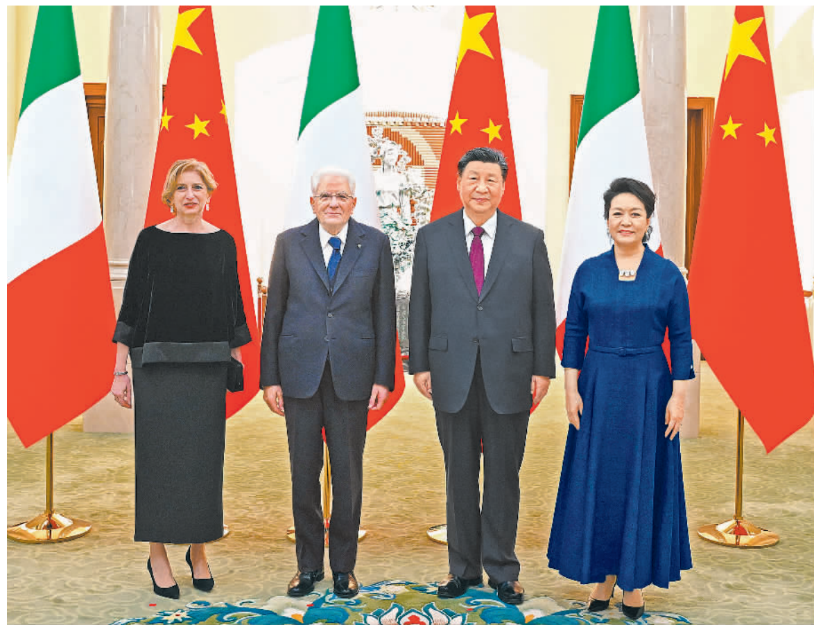
国家主席习近平在北京人民大会堂同来华进行国事访问的意大利总统马塔雷拉举行会谈。