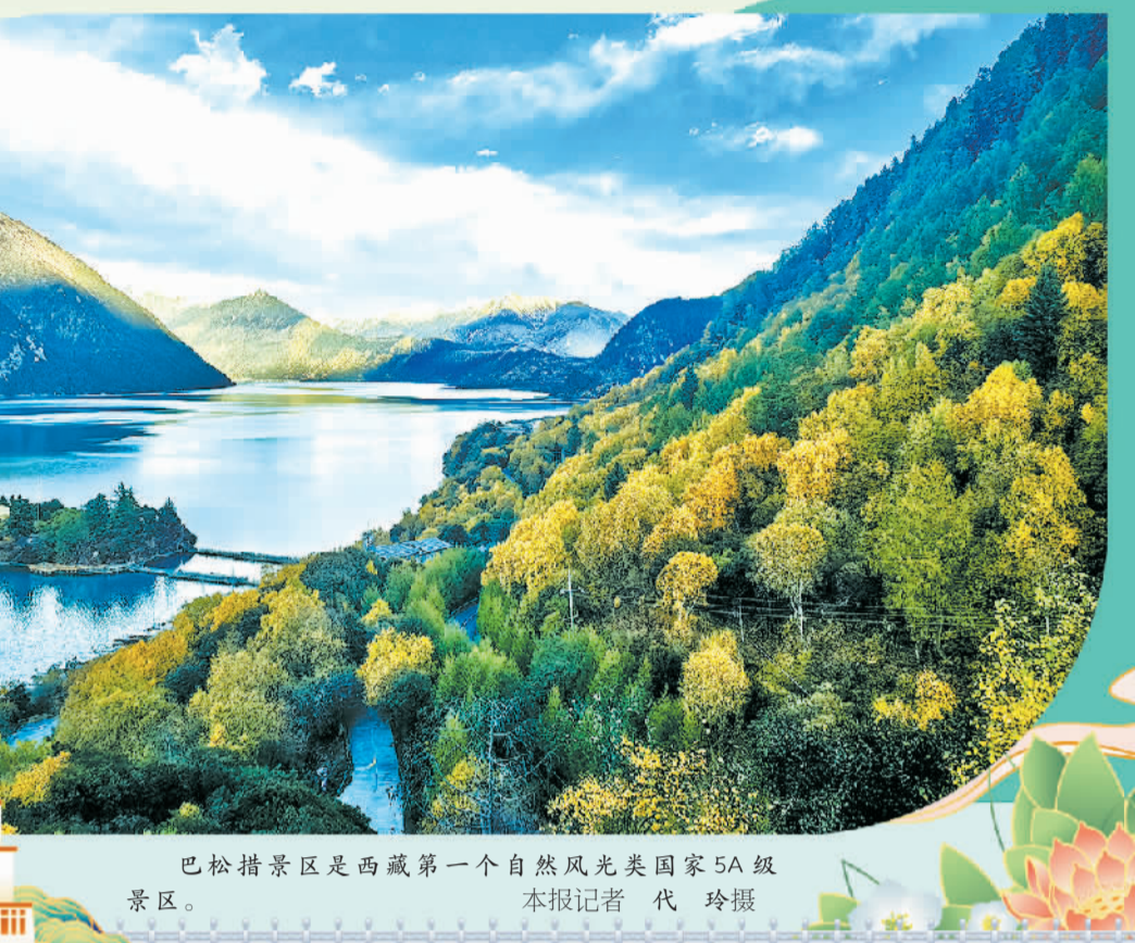
巴松措景区是西藏第一个自然风光类国家5A级景区。