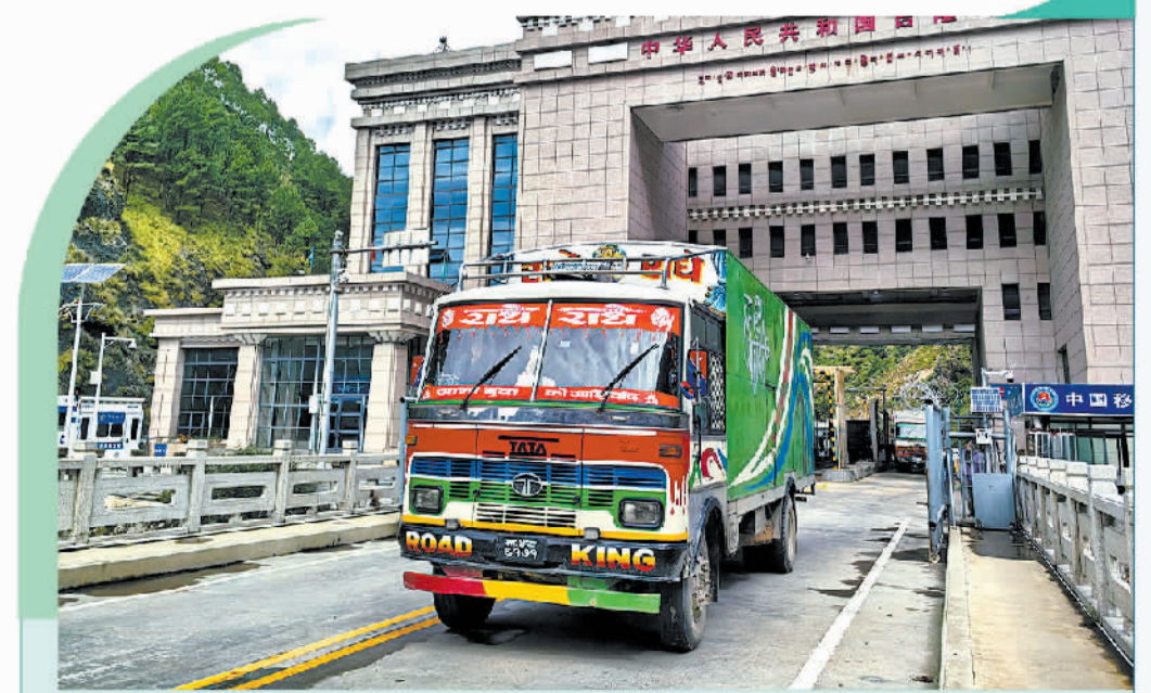
装满货物的尼泊尔车辆从位于西藏的吉隆口岸返回尼泊尔。

西藏经济基础薄弱,市场有限,开放方能拥抱未来。今年4月,来自林芝市的23.38吨苹果通过吉隆口岸销往尼泊尔,这是西藏本地水果首次实现出口;9月,13.05吨、货值151.2万元的青稞白酒、威士忌酒出口至美国,这是西藏本土青稞白酒、威士忌酒的首次出口。“首次”,在西藏农产品出口领域被