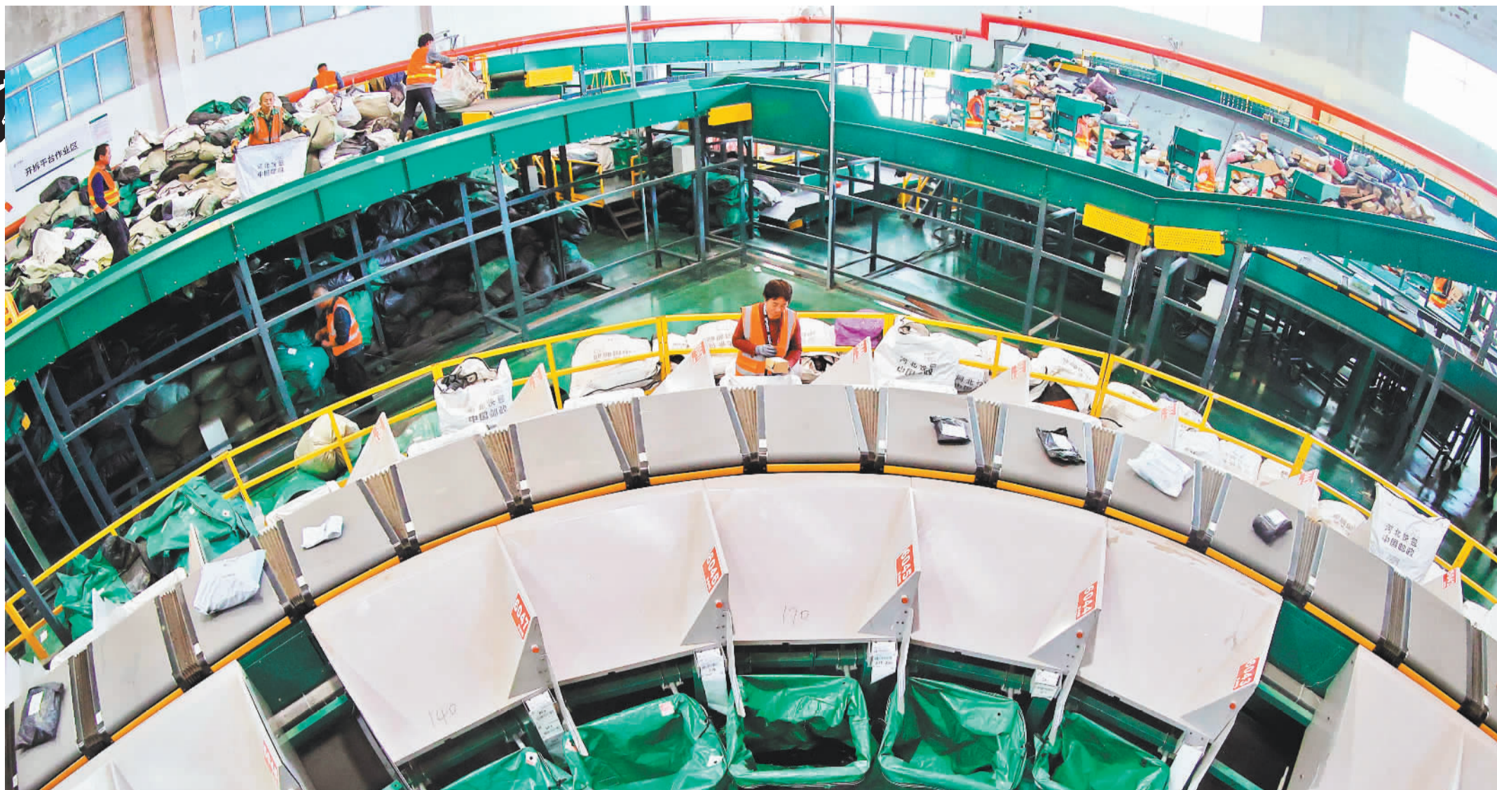
◀11月12日，中国邮政集团有限公司秦皇岛市分公司网路运营中心内，工作人员在分拣邮件。国家邮政局最新数据显示，截至11月17日，我国快递年业务量首次突破1500亿件大关。