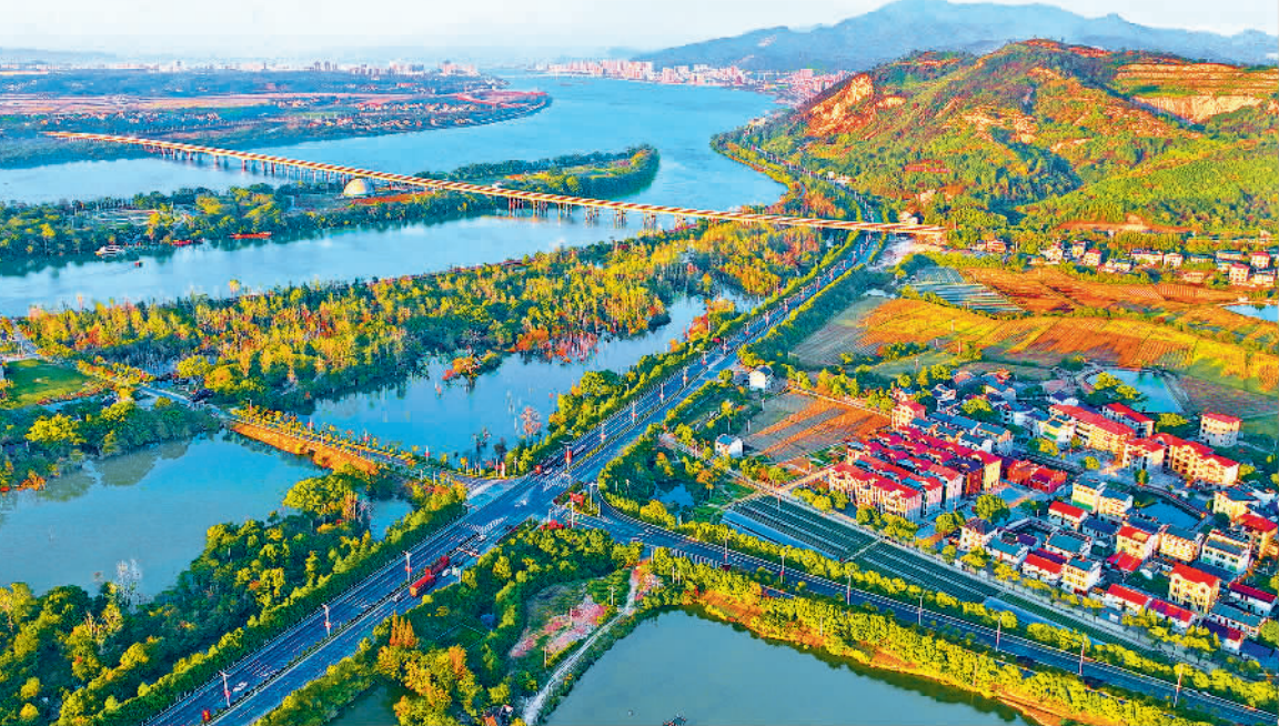
12月5日,江西省吉安市吉水县,通村公路周边农房错落有致,果蔬大棚林立。近年来,吉水县扎实推进“四好农村路”建设,带动农民种植果蔬、竹木、油茶,助力沿线村庄产业规模化、特色化发展。