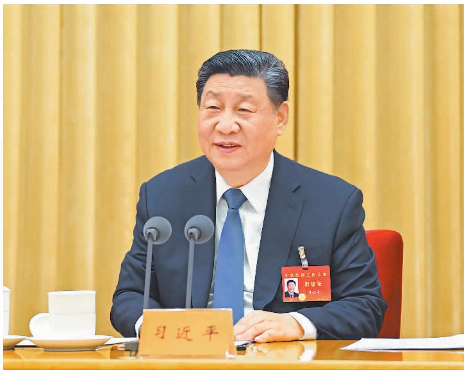
12月11日至12日，中央经济工作会议在北京举行。中共中央总书记、国家主席、中央军委主席习近平出席会议并发表重要讲话。

要实施适度宽松的货币政策。发挥好货币政策工具总量和结构双重功能，适时降准降息，保持流动性充裕，使社会融资规模、货币供应量增长同经济增长、价格总水平预期目标相匹配。保持人民币汇率在合理均衡水平上的基本稳定。