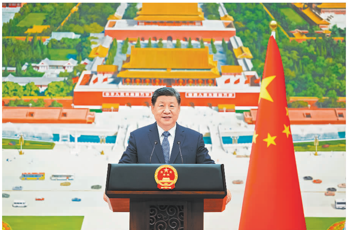
驻华大使递交国书 十二月十二日