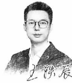
□ 本报记者 李芃达

新能源大规模跃升式发展的一大关键,是保障新能源稳定收益。相信随着网架结构和电力系统调节能力的逐步增强,以及电力市场化交易和辅助服务市场的不断完善,新能源一定能够迈过收益下滑这道“坎儿”。