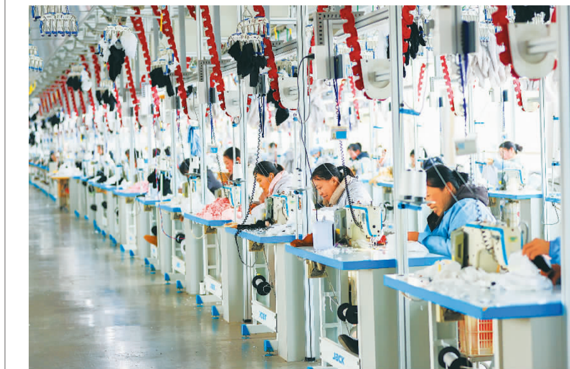
新年伊始，各地企业开足马力赶订单、忙生产，冲刺首季“开门红”。图为江苏省连云港市赣榆区石桥镇一家玩具生产企业，工人在赶制出口订单。

2024年，浙江省实现“个转企”约3万户，累计实现43.4万户。浙江省提出，到2025年底，对法律法规规定的特定行业经营应具备企业组织形式，但目前登记为个体工商户的，率先完成转型升级，提升合法经营水平；到2027年底，浙江全省企业占经营主体总量比例进一步提高，经营主体类型分布更加优化。