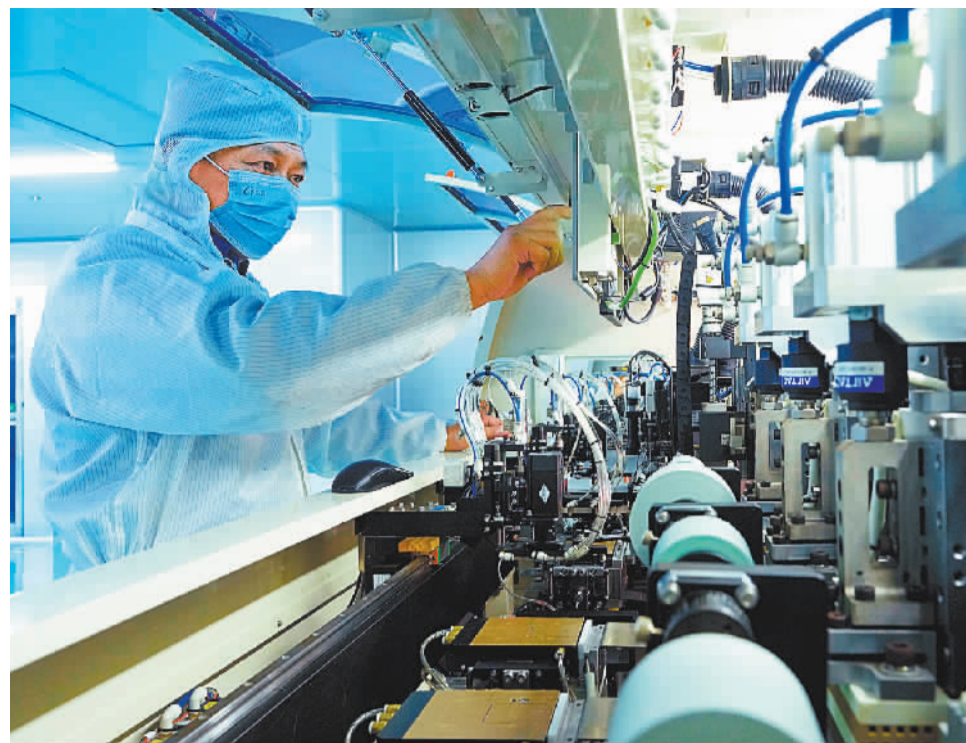
◀2024年12月25日,河南洛阳新星轻合金材料(洛阳)有限公司,工人正在生产锂电池用铝合金箔材。