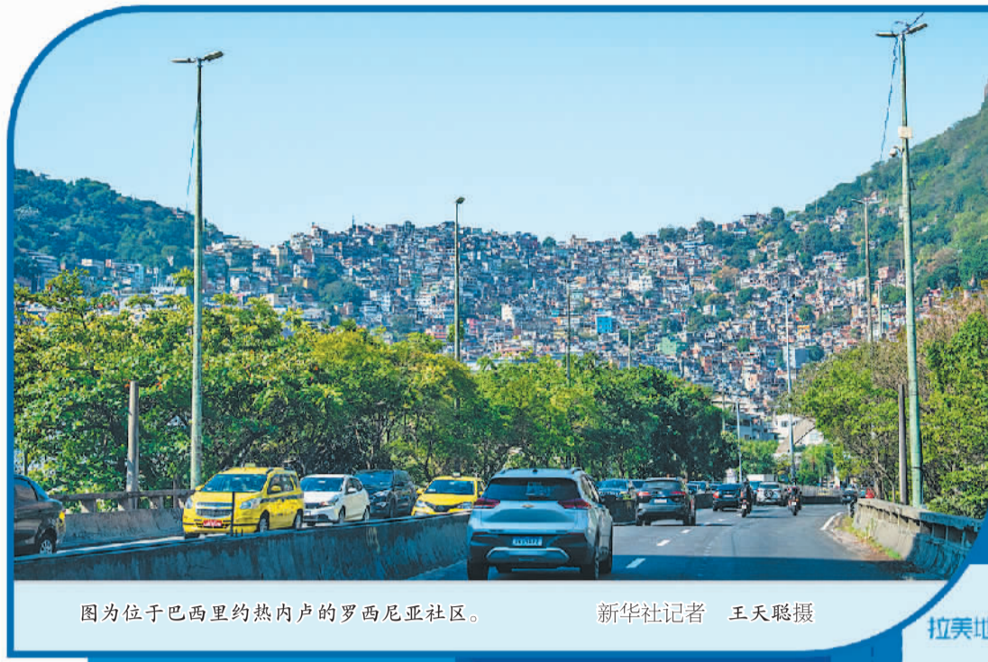
图为位于巴西里约热内卢的罗西尼亚社区。

在低增长的同时，2024年拉美地区经济呈现部分结构性变化趋势，对经济增长与发展态势产生了一定影响。一是经济的短期稳定性局部提升，货币政策空间加大。拉丁美洲和加勒比经济委员会(简称“拉加经委会”)统计显示，在