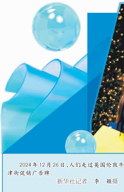
2024年12月26日，人们走过英国伦敦牛津街促销广告牌。

标普全球分析认为，英国12月的PMI快闪数据表明其经济基本处于停滞状态，与2024年初相比增长势头明显减弱。同时，英国商业信心进一步受到打击，跌至两年来的最低点，已远低于长期平均水平。英国国内企业普遍对市场前景以及成本上涨表示担忧，并将担忧情绪归咎于工党政府秋季预算案，尤其是企业缴纳的国民保险费率率的上升。企业认为这是一种变相“滞胀”税，将导致企业减少雇用员工，同时提高商品价格以向消费者转嫁成本。此外，部分外向型出口制造商还反映了对美国“保护主义”抬头和全球贸易增长乏力的担忧。英国劳动力市场的表现也显示出疲软迹象，在企业担忧秋季预算案导致用工成本上升的背景下，12月英国就业人数大幅下降，金融服务行业及娱乐行业的裁员幅度上升。英国商会调查显示，多家一线零售商、酒店均表示缩减招聘计划，并考虑裁员。相关数据显示，12月英国失业率创下2021年以来的最高水平，劳动力市场疲软可能会进一步导致消费者信心受损和家庭支出下降，增加经济下行风险。