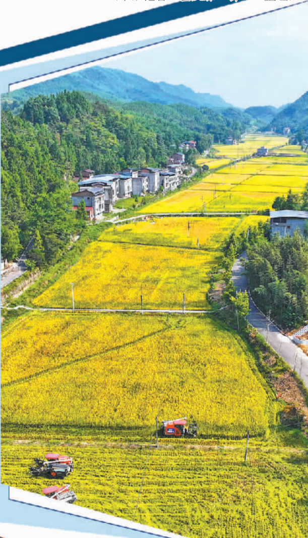
重庆市梁平区新盛镇金谷村。