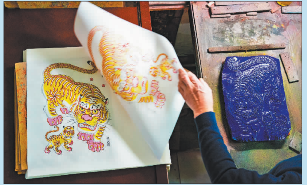
▲2024年12月25日,武强年画匠人在印刷年画。