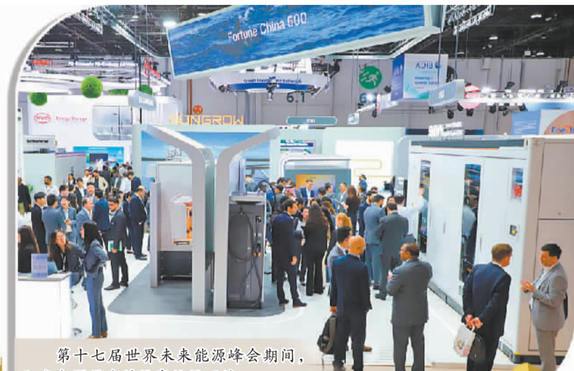
第十七届世界未来能源峰会期间,阳光电源展台的访客络绎不绝。