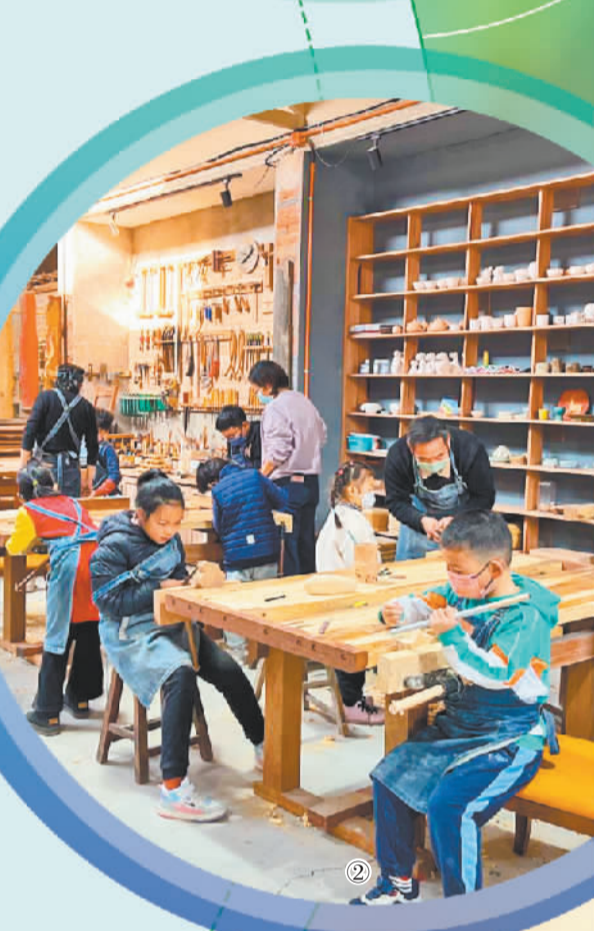
图② 在辛庄礼物手作坊,孩子们在体验木工制作。(资料图片)