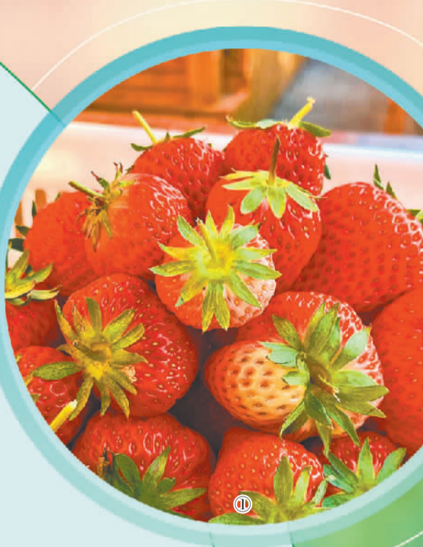
图① 辛庄集市上售卖的草莓。

“草莓田里写诗,垃圾桶旁说梦。”让土地孕育更多甜美梦想,这便是辛庄村讲述的故事。