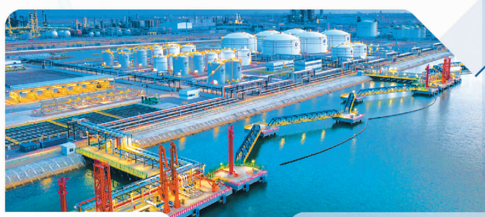
位于天津经济技术开发区的渤化液体化工码头工程现场。(资料图片)