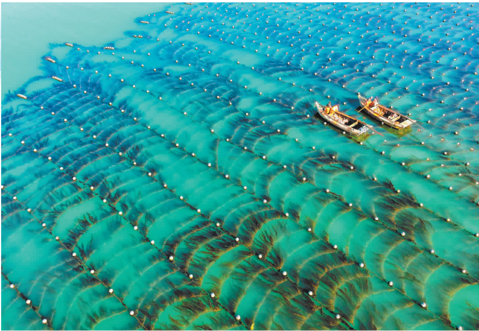
▼2月20日,天津渤海海域,渔民在进行海上捕捞作业。