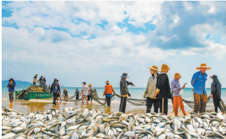
▲2月20日,海南三亚市天涯区渔业队渔民在装卸渔获渔具。2024年全国海洋渔业实现增加值4880亿元,比上年增长4%。