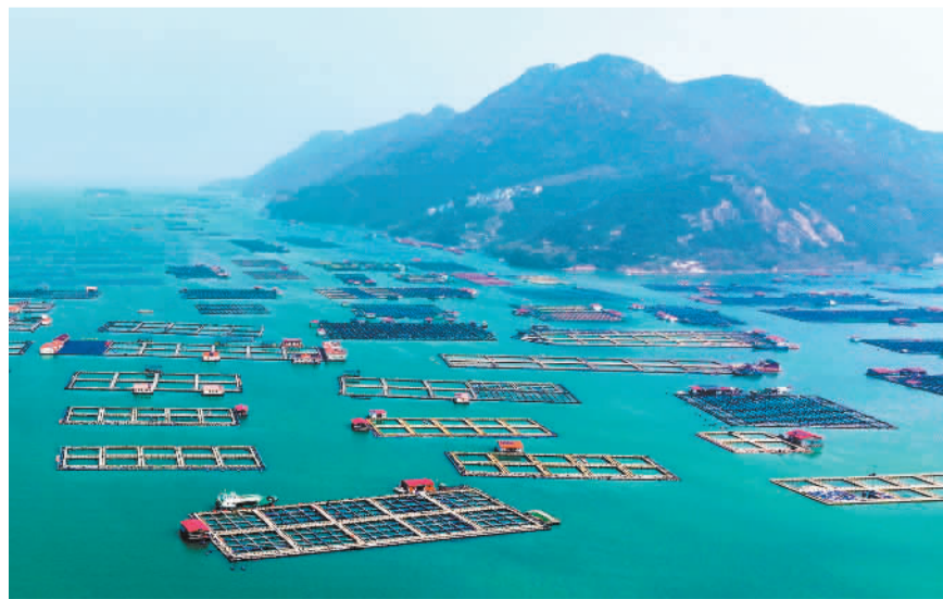
▼2月17日,福建宁德市蕉城区,白基湾海域大黄鱼养殖网箱排列整齐,蔚为壮观。

本版编辑 高兴贵 刘月杨 投稿网站 https://v.jingjiribao.cn/