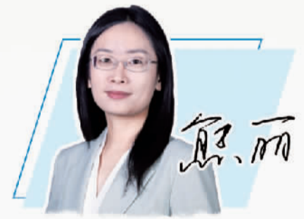
本版编辑 李苑林 蔚美 编高妍

从政策空间看，我国今年将实施更加积极的财政政策和适度宽松的货币政策，经济政策的着力点更多转向惠民生、促消费，将更大力度促进楼市股市健康发展，加大对科技创新、绿色发展、提振消费以及民营、小微企业等的支持。同时，纵深推进全国统一大市场建设，综合整治“内卷式”竞争。这些政策瞄准影响经济循环的堵点卡点靶向发力，有利于提振需求稳定预期，推动供需关系更加均衡。随着政策措施逐步落地显效，我国经济回升向好势头有望进一步增强，支撑价格回升的有利因素也将逐步增多。