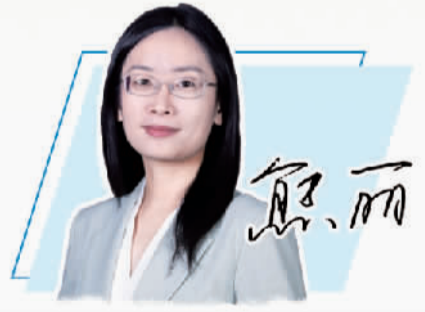
本版编辑 李苑林 蔚美 编 倪梦婷

节约粮食减少浪费，相当于增加“无形良田”。粮食安全是“国之大者”，关乎每个人的切身利益。实现“1.4万亿斤左右”的目标，端牢中国饭碗，需要14亿多人共同努力。