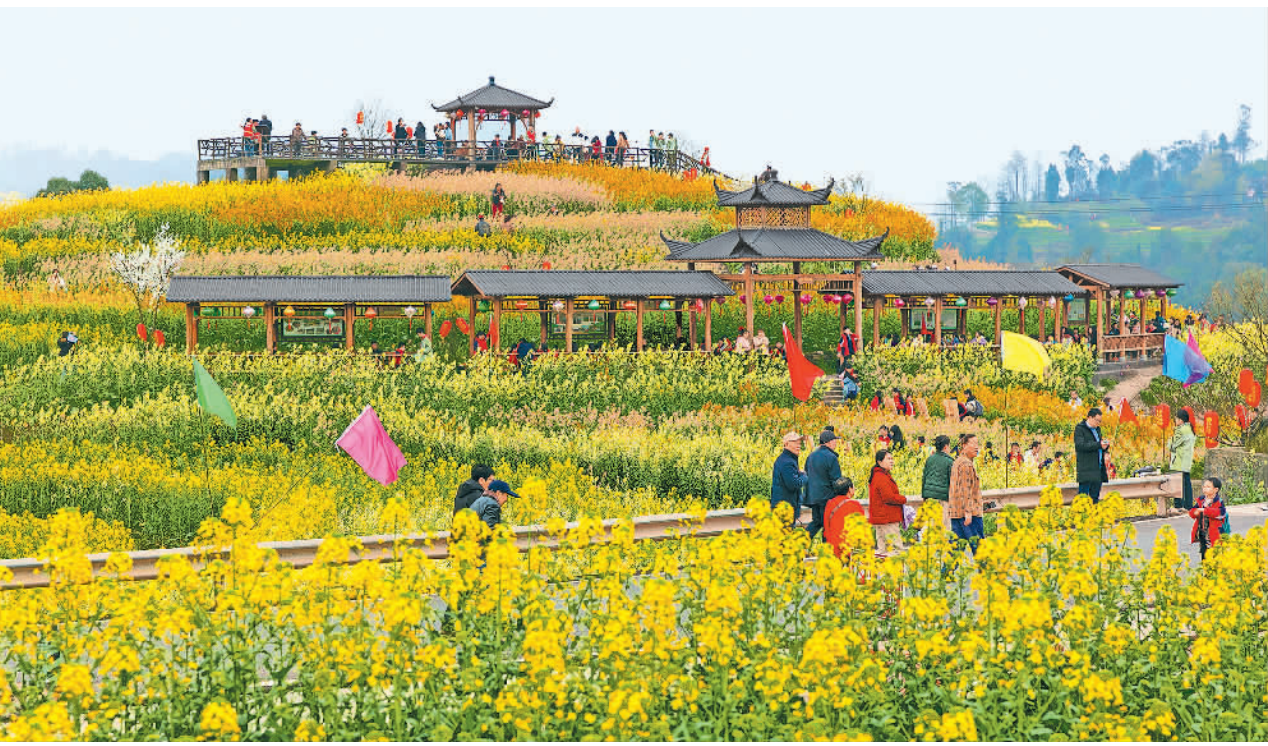
阳春三月,重庆市南川区鸣玉镇中心社区向家沟的油菜迎来盛花期,吸引了众多游客前来赏花游玩。近年来,当地引进新品种开展科学种植,成功打造出五彩油菜花景观,带动了当地农民收入增长。