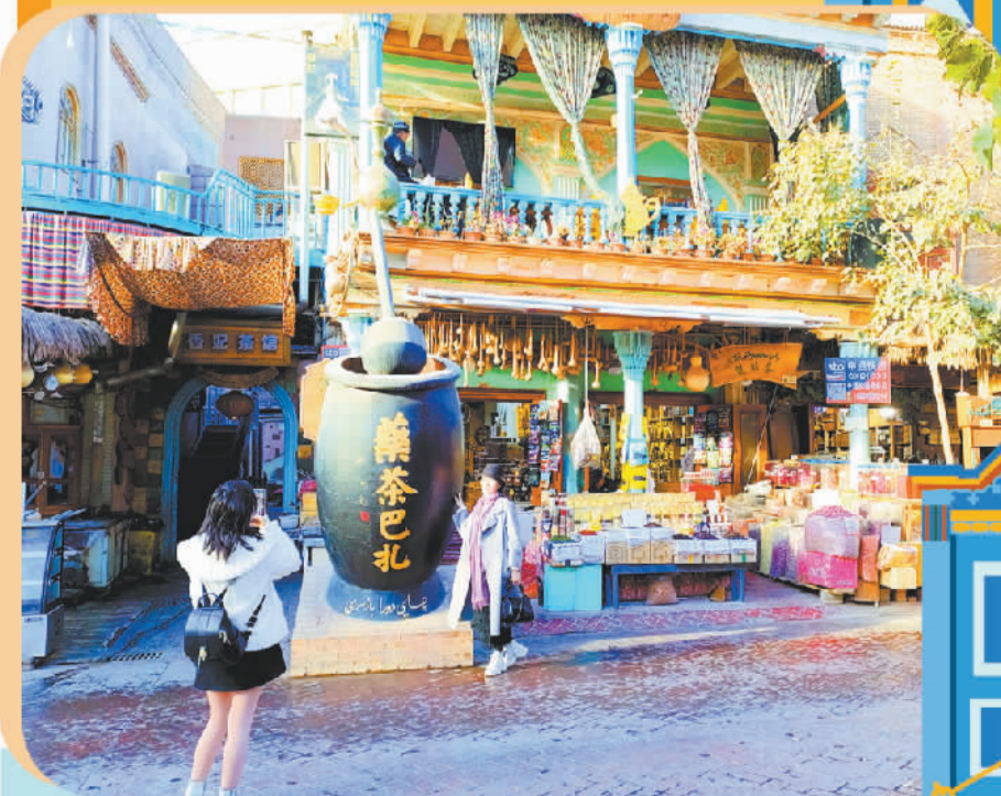
游客在新疆喀什古城药茶巴扎拍照留念。

2015年 喀什古城景区获评国家5A级旅游景区 2024年5月1日起 《新疆维吾尔自治区喀什古城保护条例》 正式施行