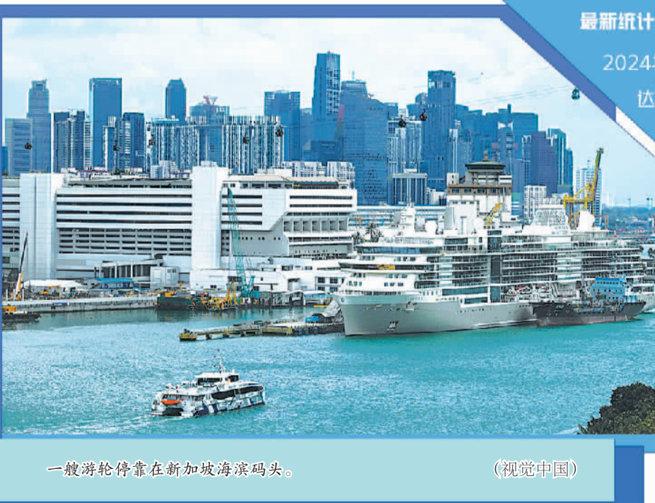
一艘游轮停靠在新加坡海滨码头。