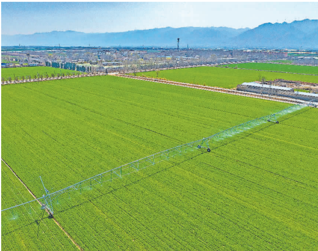
3月19日，山西省运城市永济市柳头镇农民用全自动移动式管道喷灌设备给小麦浇水。随着气温逐渐回升，当地利用晴好天气抢抓春耕生产。