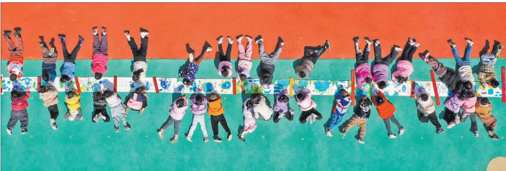
▶在第33届“世界水日”、第38届“中国水周”来临之际,3月19日,山东省东营市广饶县广饶街道锦湖幼儿园,孩子们在老师的指导下绘制节水长卷。