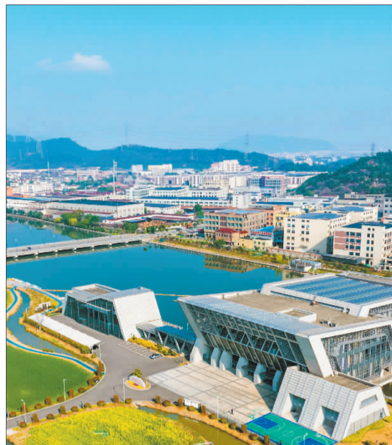
▲3月19日,浙江省宁波市镇海区游浦闸站水清河畅。