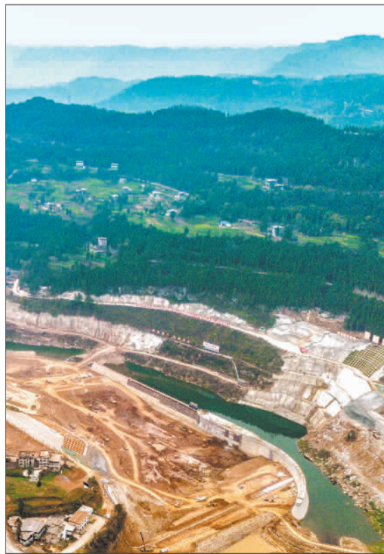
▼3月19日,江西省吉安市永丰县恩江镇恩江河段,工人在对河道进行清淤疏浚。