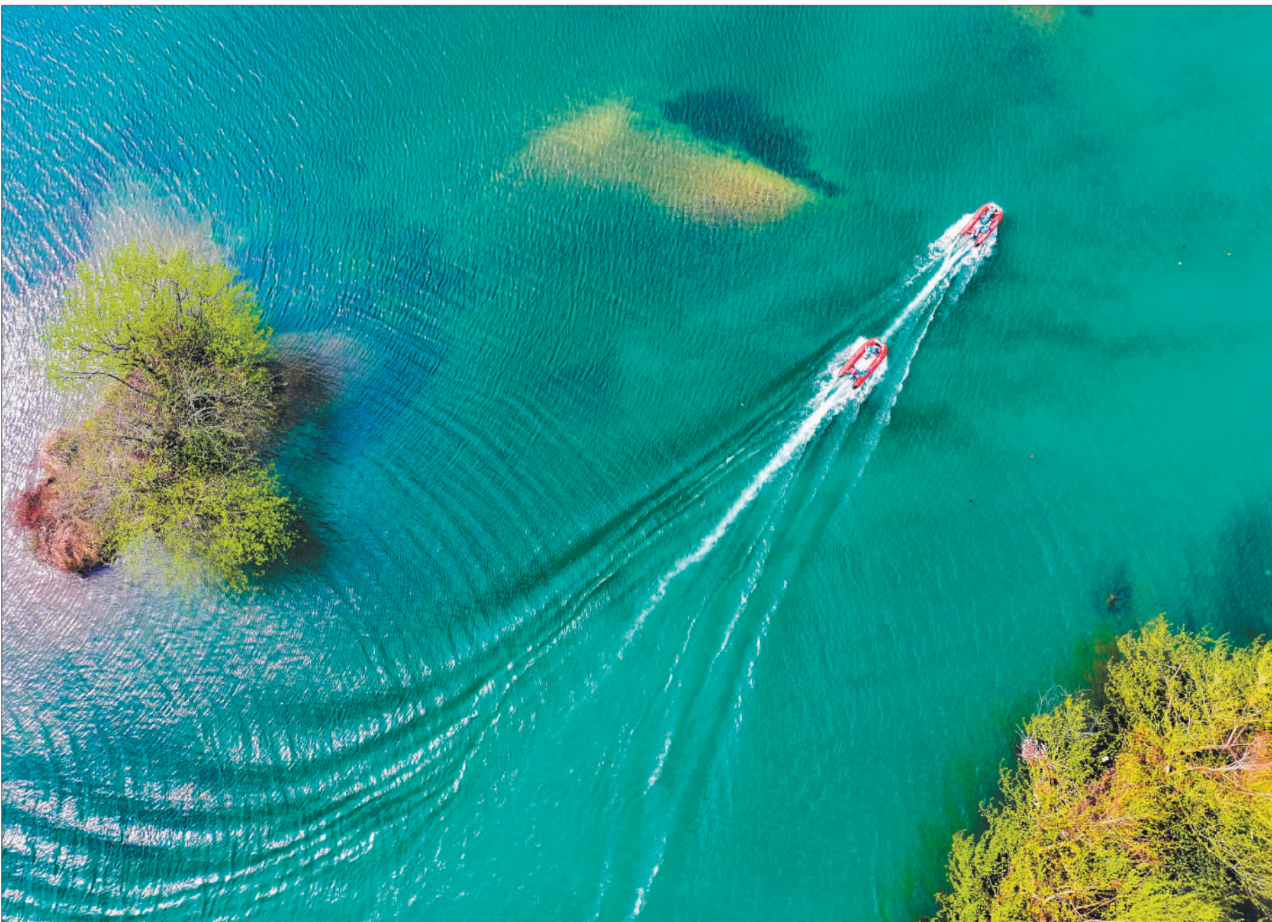
▲3月11日,湖南省永州市道县祥霖铺镇两河口村,民间河长和志愿者驾驶快艇巡护河面。