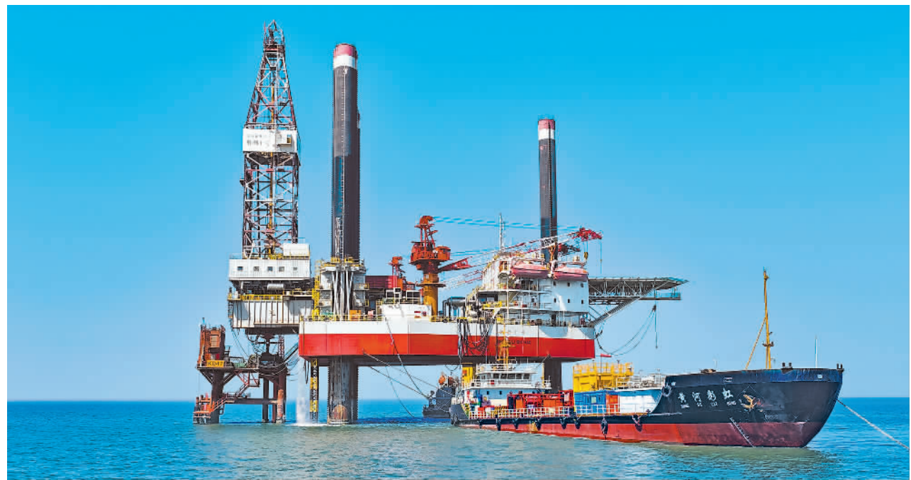
3月22日,施工船舶和胜利十号钻井平台正在对垦东47井组的油井进行投产作业。近日,胜利海上油田垦东473区块产能建设项目顺利完工,部署的3口新井初期单井日产油均超过百吨。