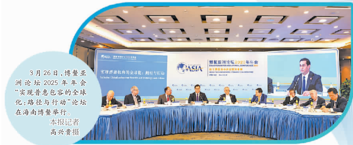
3月26日，博鳌亚洲论坛2025年年会“实现普惠包容的全球化：路径与行动”论坛在海南博鳌举行。