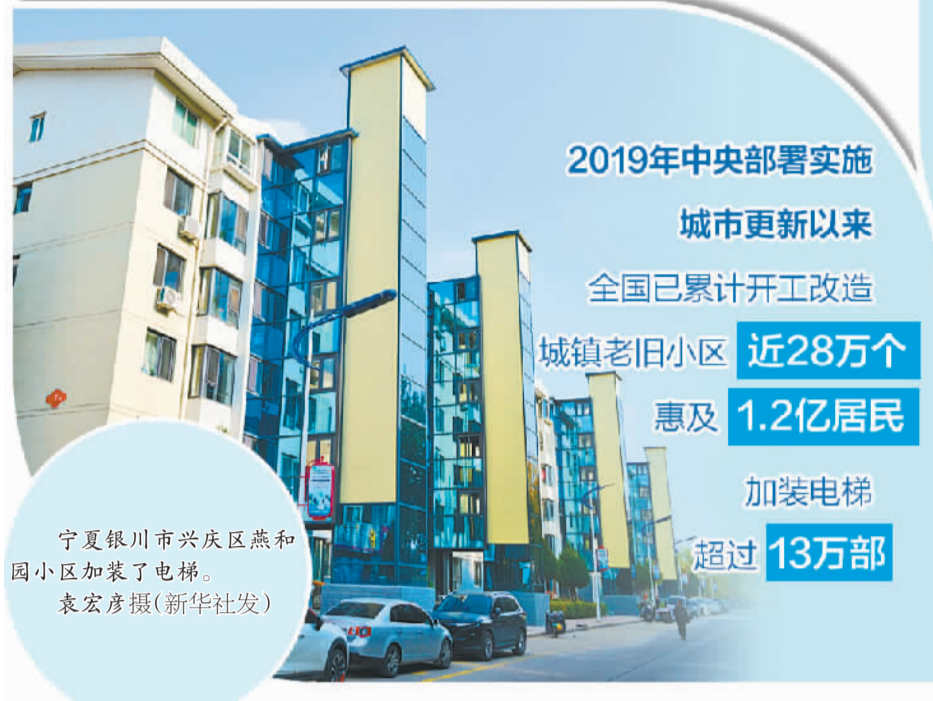
宁夏银川市兴庆区燕和园小区加装了电梯。

北京市平谷区南小区老旧小区改造过程中,以微利模式激活了区域经济,同时利用文化标签唤醒了闲置空间。有关企业投资1640万元,共盘活南小区锅炉房、滨河街道原办公楼等低效闲置资产4781平方米,打造一体多能的嵌入式社区服务综合体,出租率高,实现微利可持续,拉动周边相关产业协同发展。打造“桃小平”“桃小谷”形象,依托传统节日举办系列文化活动,吸引了大量居民和游客。