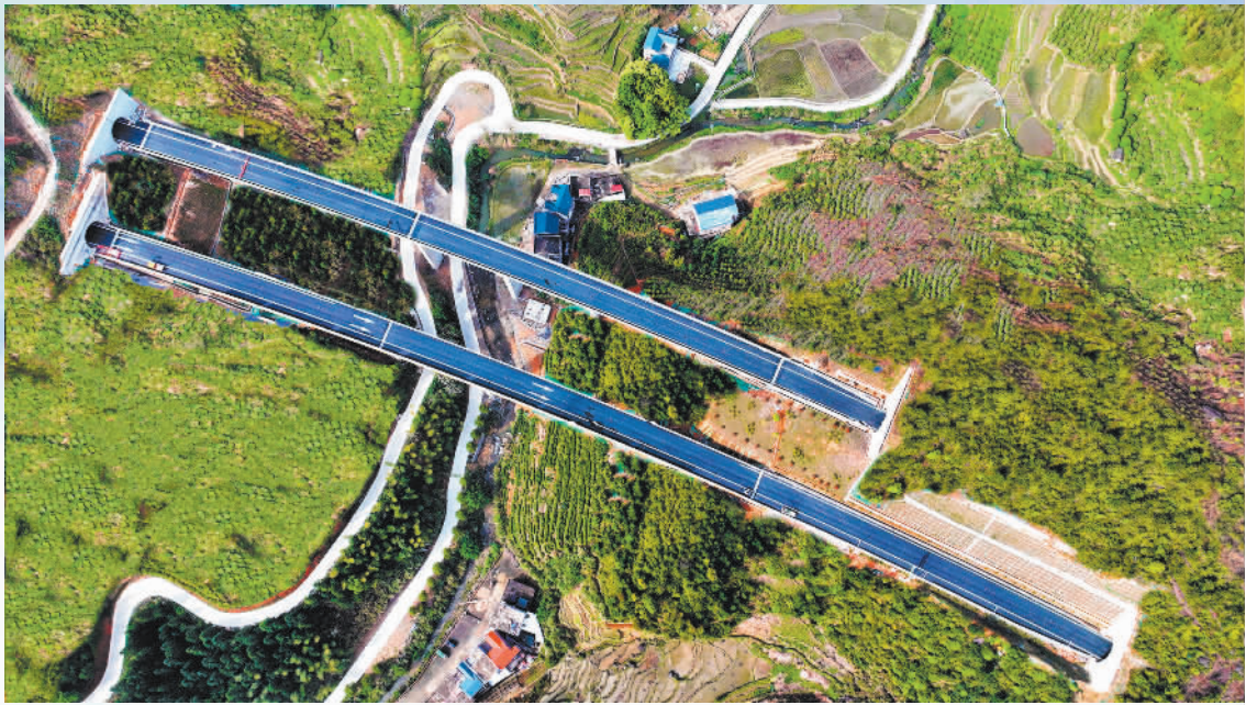
▼4月14日,建设中的江西遂(川) 大(余)高速(遂川段)交织于青山绿野, 横亘山峦。