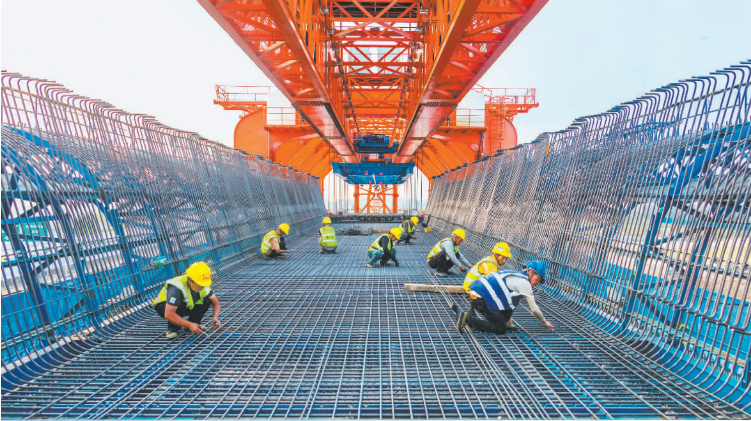
◀4月10日,位于广东东莞的深江 高铁跨沿江高速特大桥建设现场,工人 们在有序施工。