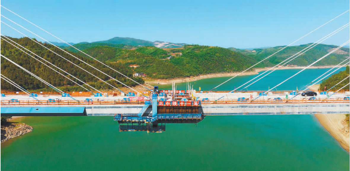
▲4月14日,湖北十堰,西十高 铁汉江特大桥合龙。该特大桥是国 内最大跨度梁桁组合结构斜拉桥, 也是西十高铁全线控制性工程。