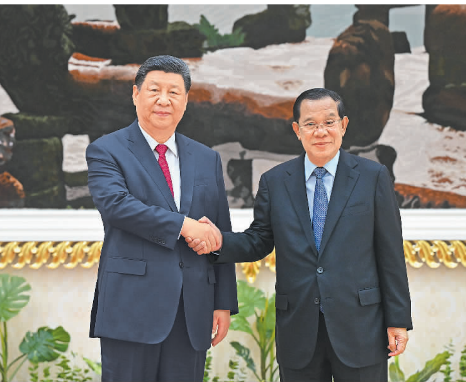
4月17日下午,国家主席习近平同柬埔寨人民党主席、参议院主席洪森在金边和平大厦举行会见。

新华社金边4月17日电(记者韩墨 刘锴)4月17日下午,国家主席习近平同柬埔寨人民党主席、参议院主席洪森在金边和平大厦举行会见。 习近平指出,中柬两国是友好邻邦,更是铁杆朋友。构建中柬命运共同体是历史的选择、人民的选择。当前,中柬两国都处在国家发展的关键阶段,双方要心系人民福祉,胸怀人类进步,在推进各自现代化进程中,为构建人类命运共同体树立典范,携手做世界百年变局中的和平力量、稳定力量、进步力量。 习近平强调,中方相信柬埔寨国家发展振兴之路一定会