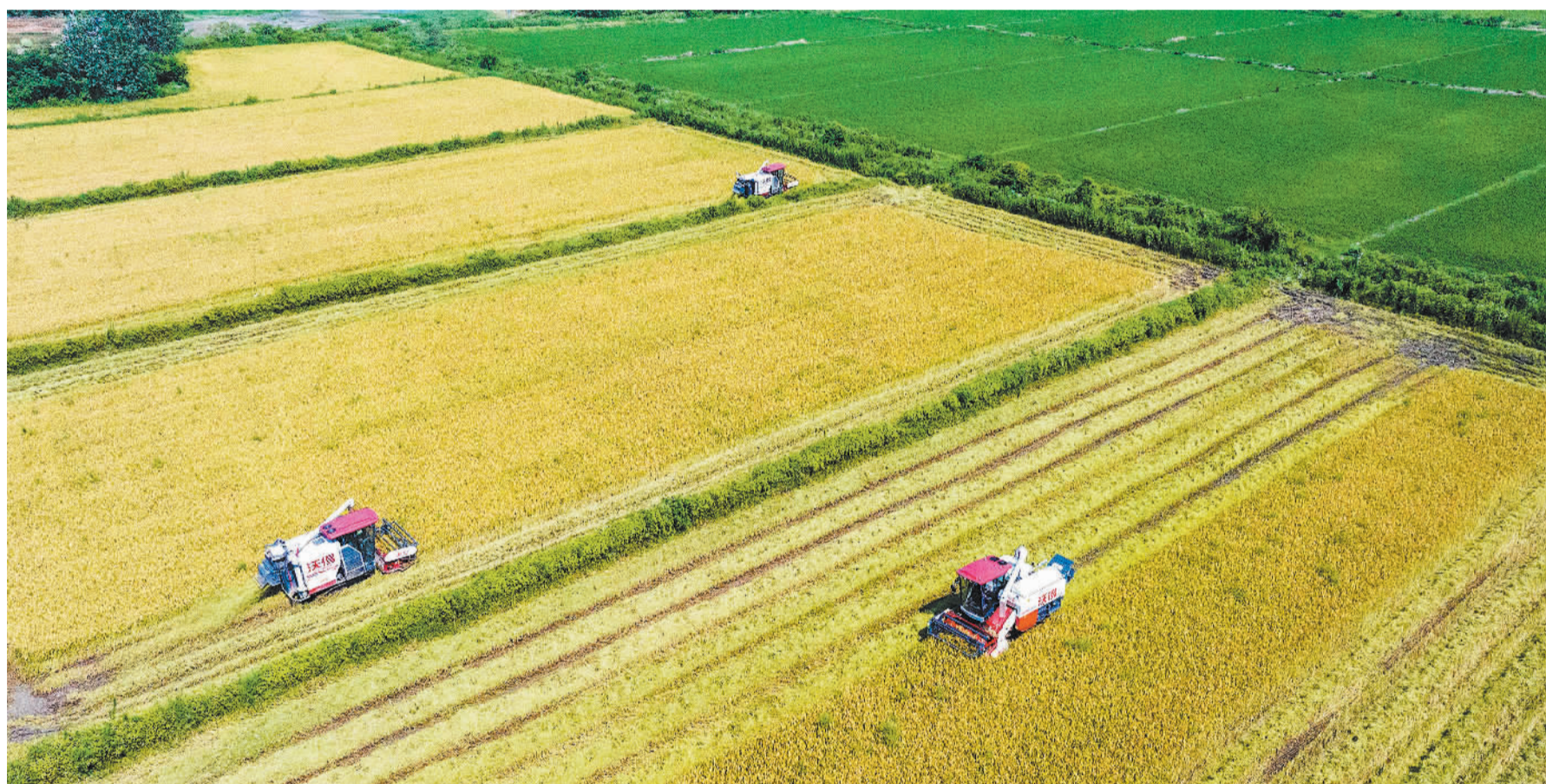
7月8日，江西省九江市都昌县北山乡跑马巷村，农民抢抓农时，冒着酷暑收割早稻。近年来，当地持续提升粮食综合生产能力，通过推进高标准农田建设、推广机械化种植，助力丰产丰收。

庞溟表示，从长期来看，黄金在避险、抗通胀、长期保值增值等方面仍具有不可替代的优点，我国央行在国际储备组合配置中加入和动态调整黄金储备的政策动机不会改变。