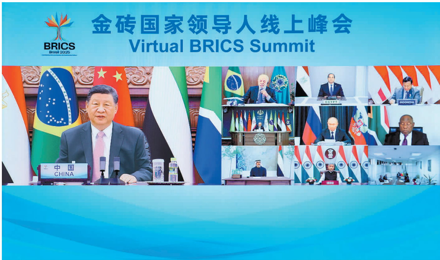
9月8日晚,国家主席习近平出席金砖国家领导人线上峰会,并发表题为《团结合作 砥砺前行》的重要讲话。