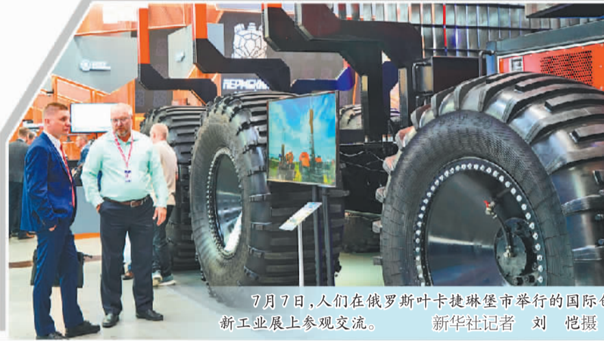
7月7日，人们在俄罗斯叶卡捷琳堡市举行的国际创新工业展上参观交流。

算赤字高于央行基线预测，监管机构在下调关键利率方面的操作空间将受到限制。有业内专家指出，俄央行发出的信号非常明确，预算赤字扩大将导致货币政策宽松步伐放缓。