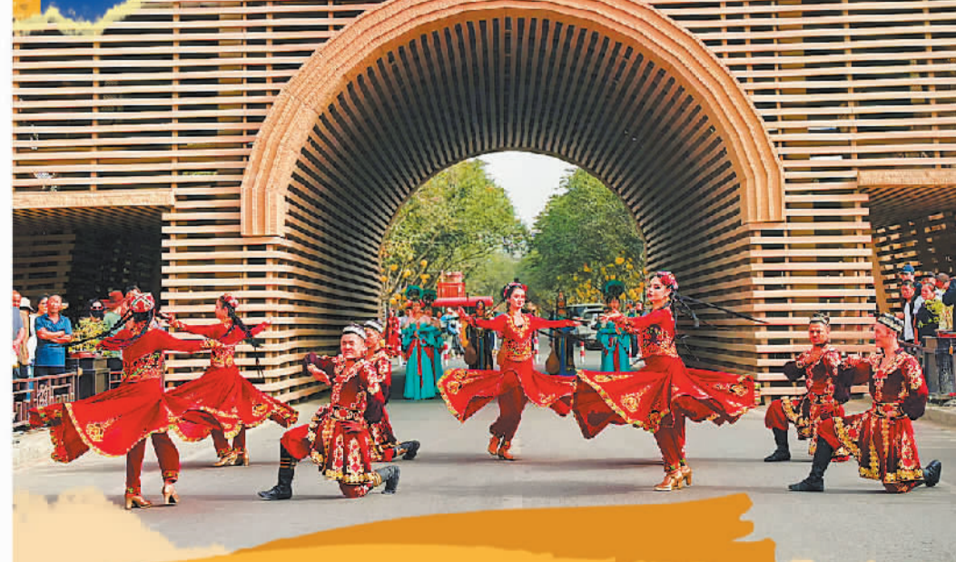
库车市清代城墙遗址，开城仪式吸引市民游客围观。