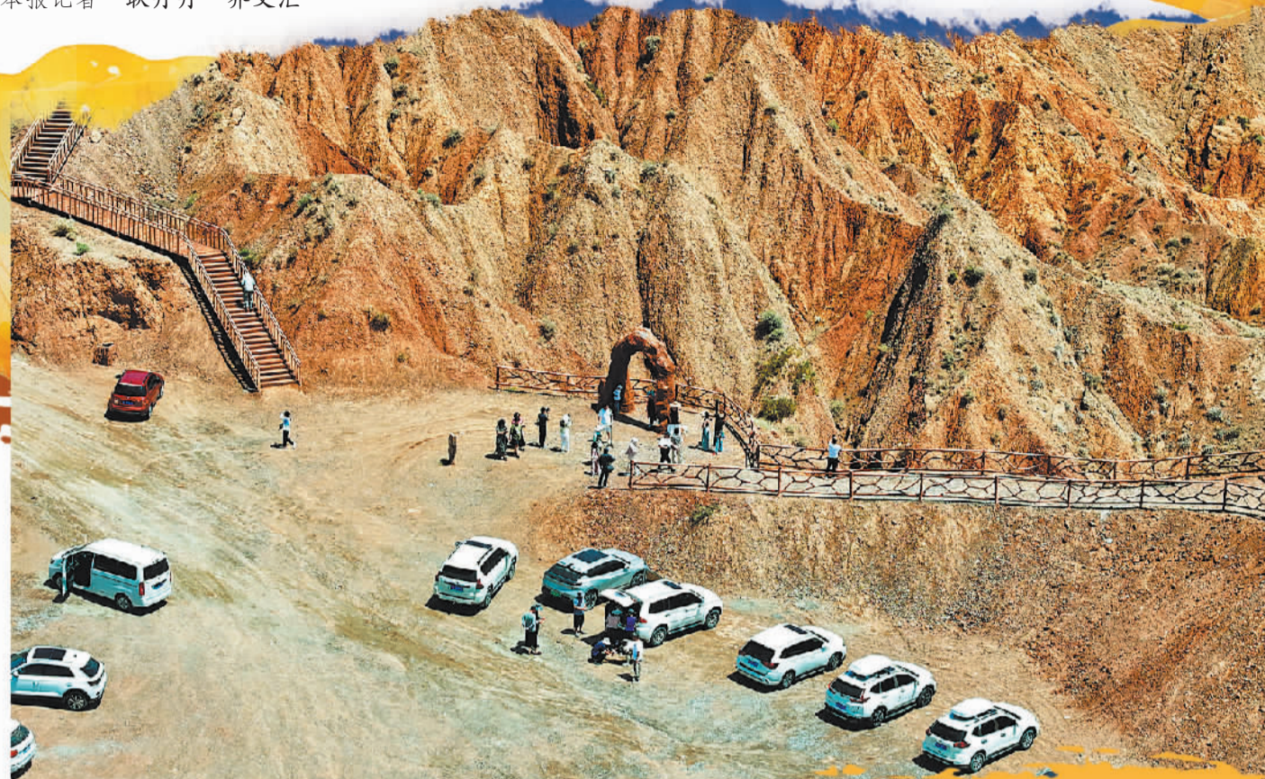
今年独库公路恢复通车以来，新疆库车市克孜利亚大峡谷景区成为众多自驾游爱好者的旅行目的地。

当各地文旅都在思考如何让流量变留量、怎样破解“千城一面”难题时，丝路古城新疆库车提供了它的答案。近年来，库车市深耕千年龟兹文化沃土，借力独库公路的火爆流量，持续完善基础设施，不断提升服务品质，构筑独特文旅标识，文旅产业实现显著增长。让千年古城焕发新生，让文旅资源实现增值，库车做对了什么？