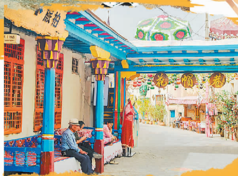
库车市热斯坦历史文化街区内，居民悠闲地享受午后时光。

网红公路带动库车段沿线旅游服务体系全面提升。每年独库公路恢复通车后，库车市都会强化独库公路综合治理，与公安、气象等部门建