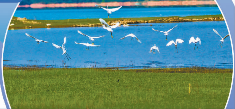
浙江淳安县文昌镇白鹭乐园中的白鹭振翅飞翔。