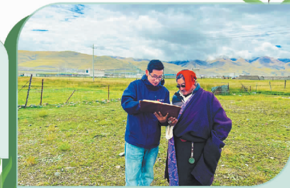
在拉萨市当雄县，人保财险西藏分公司营业员(左)为当地牧民讲解保单条款。

冻精站提供近400万元风险保障，并建立风险评估机制，将自然灾害、设备损坏、疫病风险等纳入全程监测。“保险保障让我们更敢引种、更敢创新。”贡觉才旺表示，冻精站的安全运行、优质种源推广以及牧民养殖信心的提升，都离不开金融活水的支持。