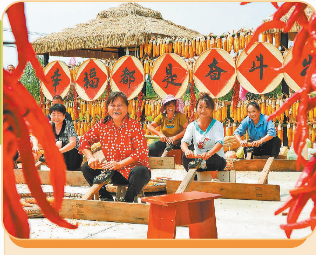
四川省达州市渠县马鞍村乡村运动会上，村民在参加玉米脱粒比赛。

日前，一款名为“川善治”的乡村治理数字平台，因引入“游戏化”治理理念，在网络上引发广泛关注与热议。这款小程序将乡村日常事务管理与游戏机制巧妙融合，村民可通过参与公共事务、建言献策获取积分并兑换奖励，村干部则像完成“游戏任务”一样处理村民诉求，全程接受评价打分。这一模式，不仅让乡村治理变得高效、透明，更添了几分趣味。 “川善治”的亮点，在于显著降低了治理成本。村民通过平台即可快速定位所需服务、信息与资源，匹配对接环节得以优化，大幅减少了时间与资源消耗。村两委也能通过平台向广大村民迅速传达重要信息，摆脱传统印刷与人工分发的束缚，有效节约人力与物力。 “游戏化”设计的引入，更是降低了参与门槛，增强了村民的归属感与参与感。用积分激励引导村民从“旁观者”转变为“共建者”，尤其吸引年轻群体关注并投身乡村事务，为基层治理注入新活力。积分制的实施，潜移默化推动村民自我管理，培育文明村风民风，推动乡村德治与法治结合，增强了社区凝聚力和向心力，逐步形成共建共治共享的治理新格局。