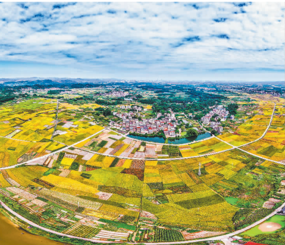
日前，广西南宁市西乡塘区石埠街道老口村上千亩连片种植的晚稻进入收获期。从空中俯瞰，金黄的稻田与村庄、村道相映成景，构成一幅色彩斑斓的乡村画卷。

据了解，在大力发展新兴产业和未来产业的同时，四川持续做深做实项目投资工作，以高质量项目支撑高质量投资、以高质量投资助推高质量发展。今年1月至8月，四川省固定资产投资同比增长0.9%，其中项目投资同比增长2.6%。截至8月底，810个川省重点项目、320个川渝共建重点项目(四川部分)年度投资完成率分别达84.6%、75.3%，国道351线夹金山隧道工程、达州普光锂钾综合开发项目等重大项目有望年内实现竣工投用。