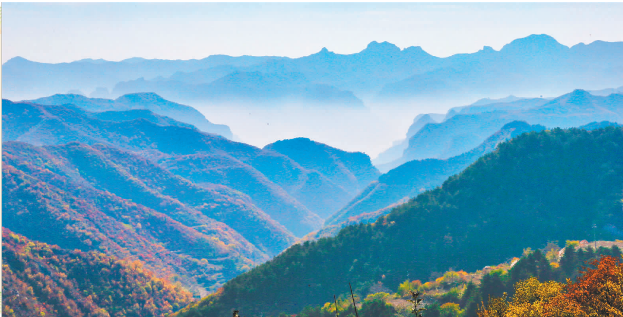
◀10月26日，游客在山西省长治市通天峡景区游览。当地不断丰富供给，完善配套设施，推动文旅加速融合。

太行山上，风光无限。长治市紧扣“吃住行游购娱”及“商养学闲情奇”旅游要素，持续深化“以文塑旅、以旅彰文”融合实践，推动文旅产业成为转型升级的“稳定器”与高质量发展的“核心极”，为资源型城市绿色转型注入强劲动能。