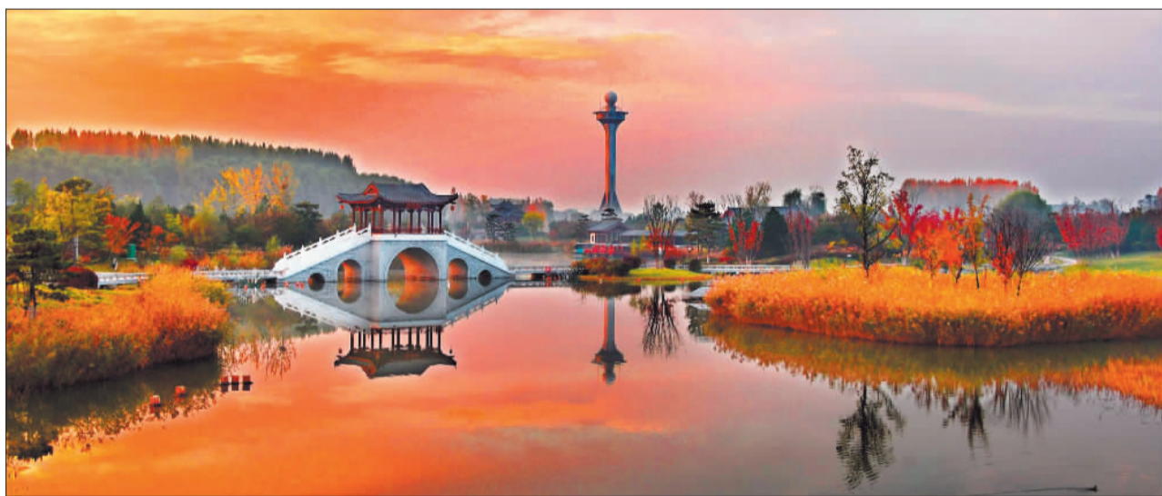
◀10月27日拍摄的长治市漳泽湖国家城市湿地公园。曾经荒草丛生的水滩，如今成为600多种野生动植物的栖息地。