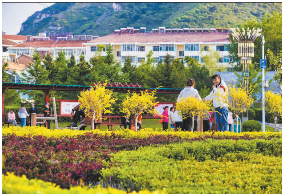
▼10月29日，市民在长治市平顺县一处口袋公园休闲。25处口袋公园和43处小微绿地，美化了环境，也成为市民休闲好去处。