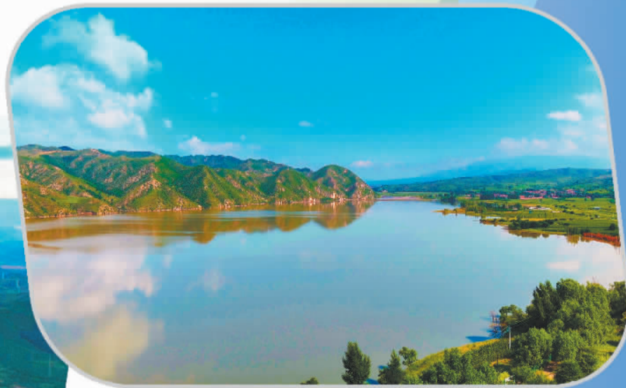
静心呵护的云州水库