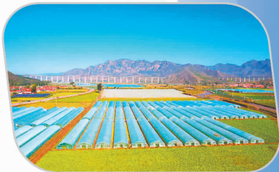
样田乡万亩蔬菜种植示范园区