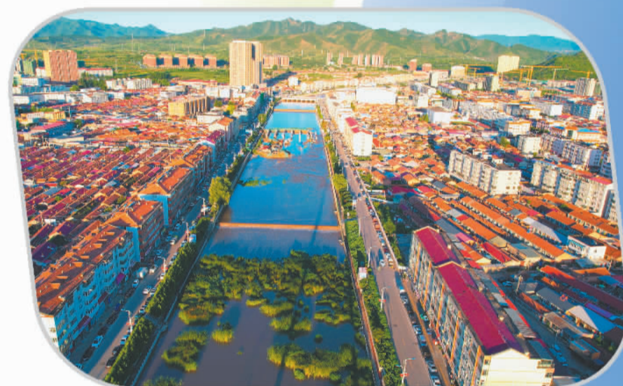
白河保护与城市发展相得益彰