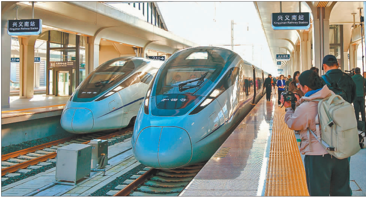
▲11月28日,随着G5356次动车组驶离兴义南站,新建贵州盘州至兴义高铁正式通车运营。

11月28日,新建贵州盘州至兴义高铁(以下简称“盘兴高铁”)正式通车运营。这标志着贵州成为西南地区首个实现市(州)中心城市高铁全覆盖的省份,正式形成省会贵阳至省内8个市(州)中心城市1小时至2小时高铁交通圈。 盘兴高铁起自贵州省六盘水市盘州市盘州站,终至黔西南布依族苗族自治州兴义市兴义南站,正线全长约99公里,共有46座桥梁、38座隧道,桥隧总长89.19公里,占线路长度约91%。 盘兴高铁的通车,补全了黔西南州综合立体交通体系的关键一环。高铁串联起马岭河峡谷、万峰林、乌蒙大草原等众多优质旅游资源,打通与黄果树、织金洞等知名景区的快速通道,形成高效的旅游环线,加快推进“交通+旅游”融合发展。同时,盘兴高铁的通车也将进一步优化黔西南州的投资环境,加速人才、资金、信息等要素流动,促进特色农业、大健康产业、新型工业化与旅游业的深度融合。 飞虹越黔山,奔驰的列车打开了黔西南对外开放的新通道,也为贵州高质量发展注入了新的活力。