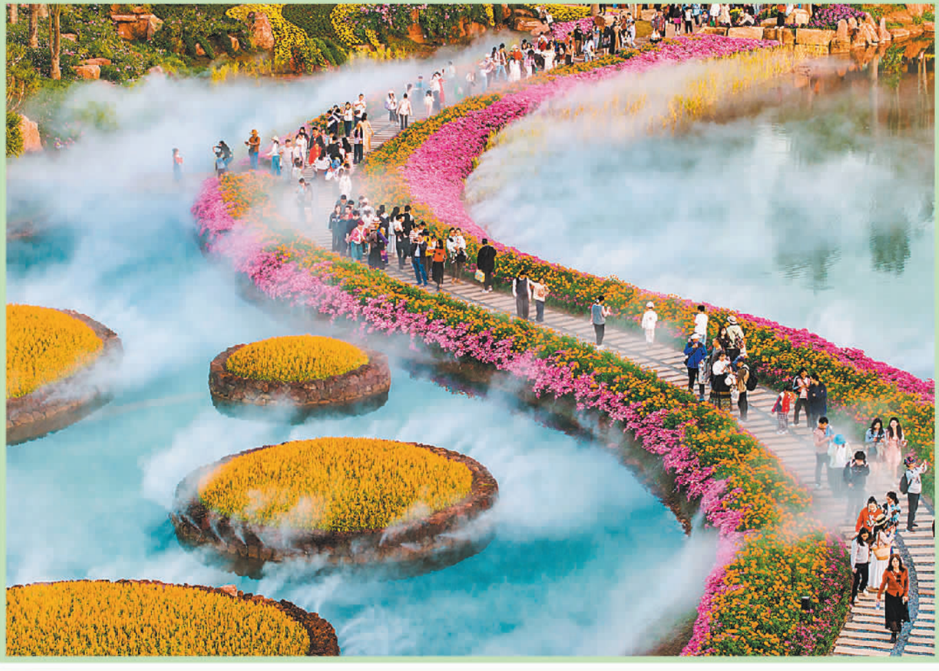
▼11月29日，广西南宁市青秀山风景区丘石花园，绚烂多彩的花海吸引游客前来游玩。