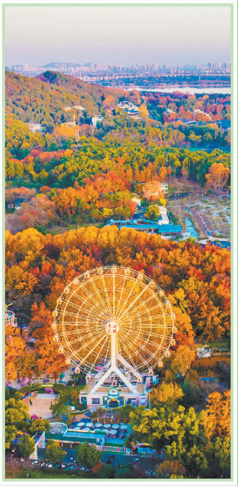
▼11月29日，湖北武汉市东湖生态旅游风景区层林尽染。12月7日是大雪节气，此时节我国大部分地区已进入冬季，北方“千里冰封，万里雪飘”之时，南方部分地区依然草木葱茏。