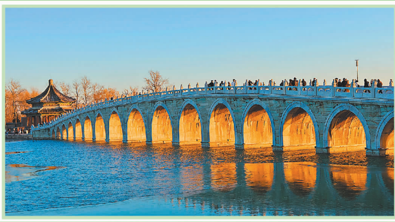
▲12月3日拍摄的北京市颐和园十七孔桥“金光穿洞”自然景观。