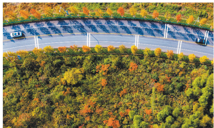
▼11月16日拍摄的安徽省芜湖市繁昌区孙村镇旅游风景道。