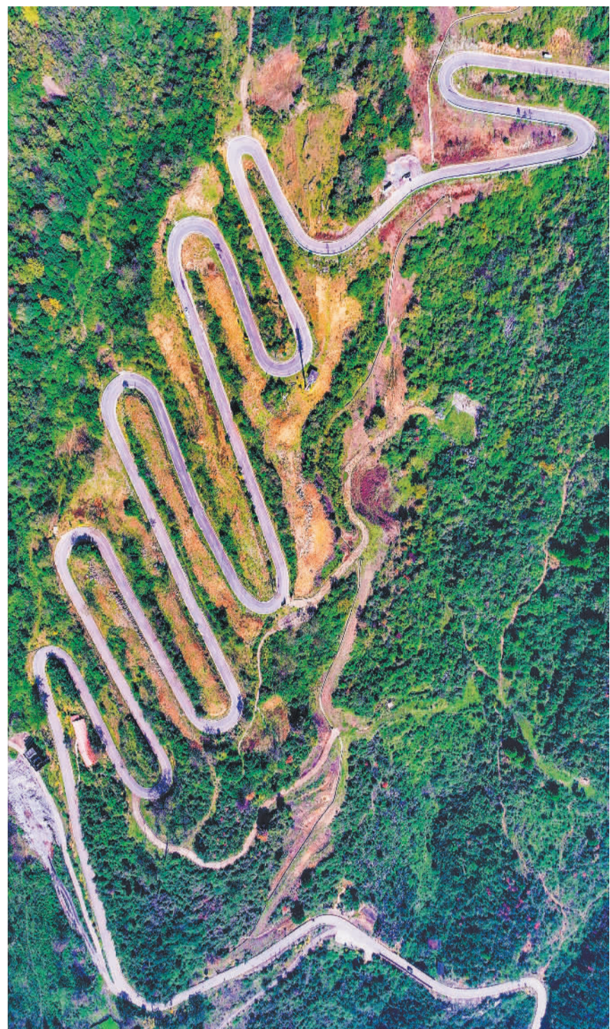
◀11月25日拍摄的贵州省毕节市织金县八步镇沟边村与黔西市五里布依族苗族乡中心村之间的“四好农村路”。近年来,当地持续推进“四好农村路”建设,打通偏远山村的交通路网,带动乡村旅游和地方特色产业发展。