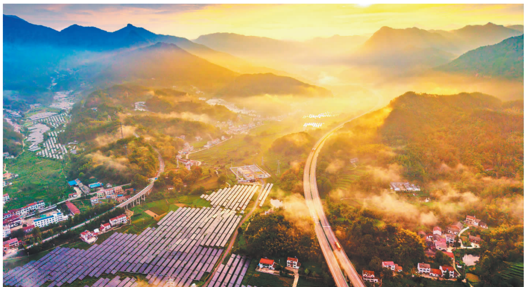
▼9月14日,湖北省黄冈市英山县杨柳湾镇新铺街村,道路、群山、村庄、光伏发电板相映成景。

本版编辑 高兴贵 李秋旻 陶天添 投稿邮箱 https://v.jingjiribao.cn/