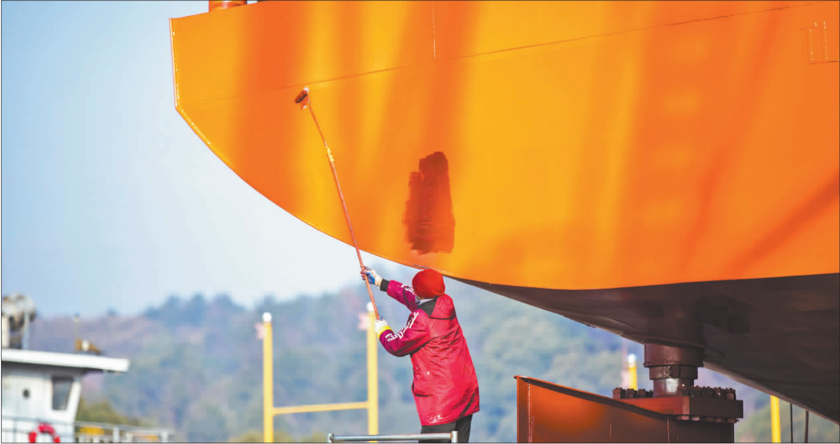
◀1月3日,江西省九江市都昌县造船总厂船舶制造工地,工人正在进行刷漆作业。