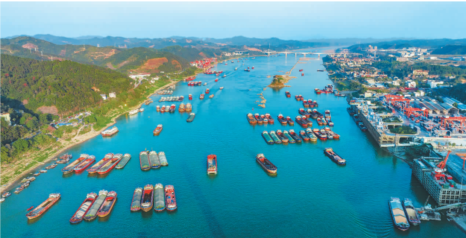
1月4日,珠江上游西江广西梧州市万秀区段,船舶在航道上有序航行。新年伊始,素有“黄金水道”之称的西江迎来航运繁忙季。

科技成果转化需要长期支持。未来,需进一步支持创业投资机构发行科技创新债,加快国家创业投资引导基金区域落地,健全国资创投基金全生命周期考核机制,优化“创新积分制”并加大对科技型中小企业的贷款与担保支持,让金融活水持续滋养科技成果转化全链条,为创新动能注入持久动力。