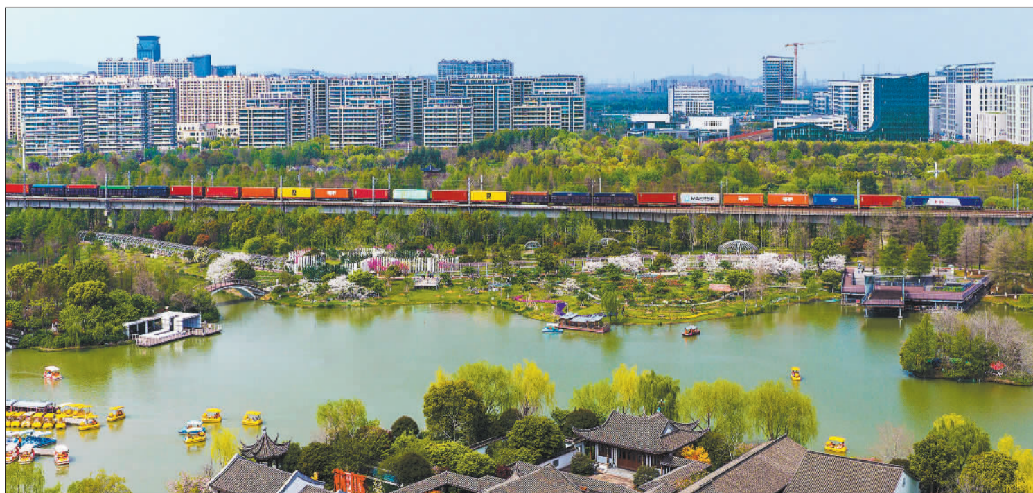
▶4月4日,一列满载集装箱的列车途经浙江省宁波镇海植物园。宁波舟山港积极发挥海铁联运等多式联运优势,海铁联运线路超110条。