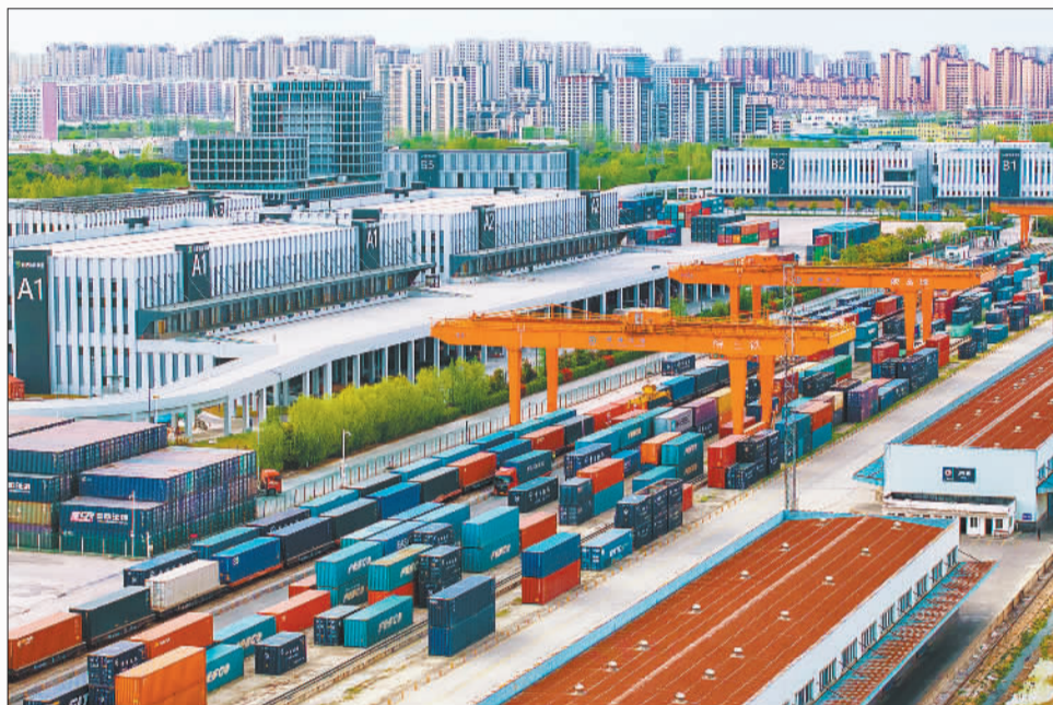
▼4月8日,位于安徽省合肥庐阳经济技术开发区的合肥北站物流基地,满载货物的中欧班列整装待发。当地加快“公路+铁路+海运”多式联运综合物流运输体系建设,今年一季度中欧班列(合肥)共发运126列,同比增长129.1%。