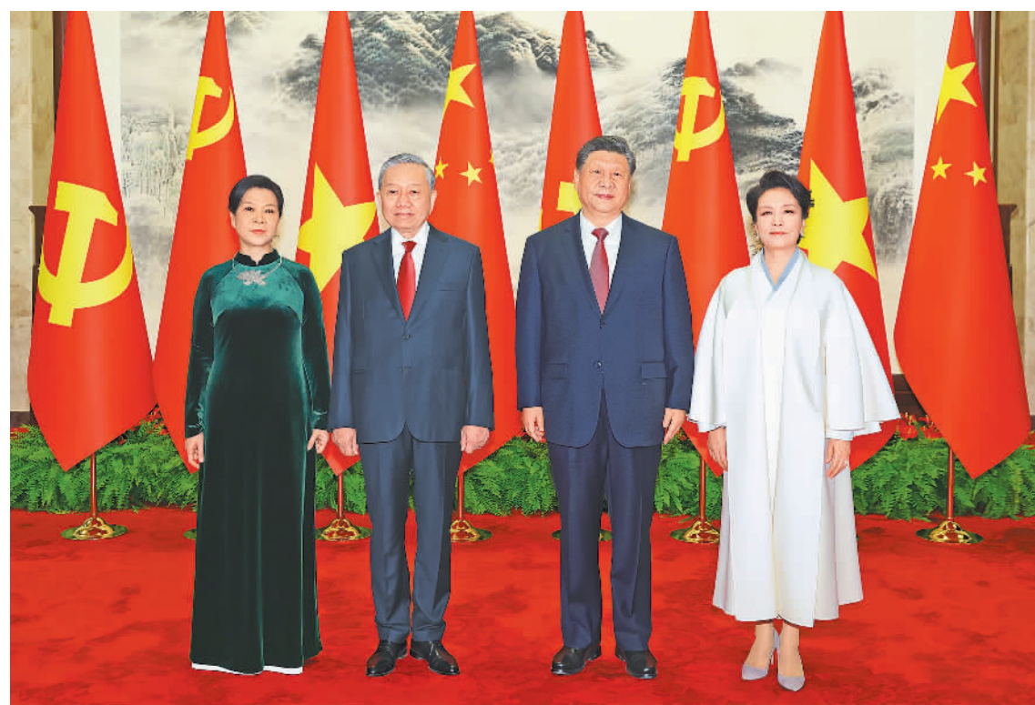
新华社北京4月15日电(记者董雪、冯歆然)4月15日上午,中共中央总书记、国家主席习近平在人民大会堂同来华进行国事访问的越共中央总书记、国家主席苏林举行会谈。 会谈在两国领导人陪同下进行。两国领导人就中越关系、国际形势、双边合作等深入交换意见,达成许多重要共识。 习近平强调,中越两国山水相连、命运与共,两国人民相知相亲、友好往来源远流长。中越两国关系是社会主义国家间的重要关系,也是亚洲乃至世界和平与发展的关键。中方愿同越方一道,推动中越全面战略合作伙伴关系不断向前发展,为构建人类命运共同体作出更大贡献。 苏林表示,越方一贯重视和发展中越友好关系,愿同中方一道,推动中越全面战略合作伙伴关系不断向前发展,为构建人类命运共同体作出更大贡献。 会谈后,两国领导人共同会见参加“红色研学之旅”的中越青年代表,并同他们合影留念。 新华社北京4月15日电(记者董雪、冯歆然)4月15日上午,中共中央总书记、国家主席习近平在人民大会堂同来华进行国事访问的越共中央总书记、国家主席苏林举行会谈。 会谈在两国领导人陪同下进行。两国领导人就中越关系、国际形势、双边合作等深入交换意见,达成许多重要共识。 习近平强调,中越两国山水相连、命运与共,两国人民相知相亲、友好往来源远流长。中越两国关系是社会主义国家间的重要关系,也是亚洲乃至世界和平与发展的关键。中方愿同越方一道,推动中越全面战略合作伙伴关系不断向前发展,为构建人类命运共同体作出更大贡献。 苏林表示,越方一贯重视和发展中越友好关系,愿同中方一道,推动中越全面战略合作伙伴关系不断向前发展,为构建人类命运共同体作出更大贡献。 会谈后,两国领导人共同会见参加“红色研学之旅”的中越青年代表,并同他们合影留念。