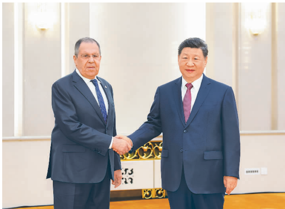
4月15日上午,国家主席习近平在北京人民大会堂会见俄罗斯外长拉夫罗夫。

新华社北京4月15日电(记者冯歆然)4月15日上午,国家主席习近平在北京人民大会堂会见俄罗斯外长拉夫罗夫。 习近平请拉夫罗夫转达对普京总统的诚挚问候。习近平指出,今年是中俄战略协作伙伴关系建立30周年,也是《中俄睦邻友好合作条约》签署25周年,两国全面战略协作伙伴关系保持高水平发展,各领域合作成果丰硕。面对变乱交织的国际形势,中俄关系的稳定性和确定性尤为宝贵,《中俄睦邻友好合作条约》的强大生命力和示范意义更加凸显。双方要全力落实我和普京总统达成的重要共识,加强战略沟通,密切外交协调,推动中俄全面战略协作伙伴关系站得更高、走得更稳、行得更远。 习近平强调,面对百年未有之大变局,中俄要以更加密切有力的战略协作,坚定捍卫两国正当利益,维护全球南方国家团结,体现大国和联合国安理会常任理事国的责任担当。(下转第二版)