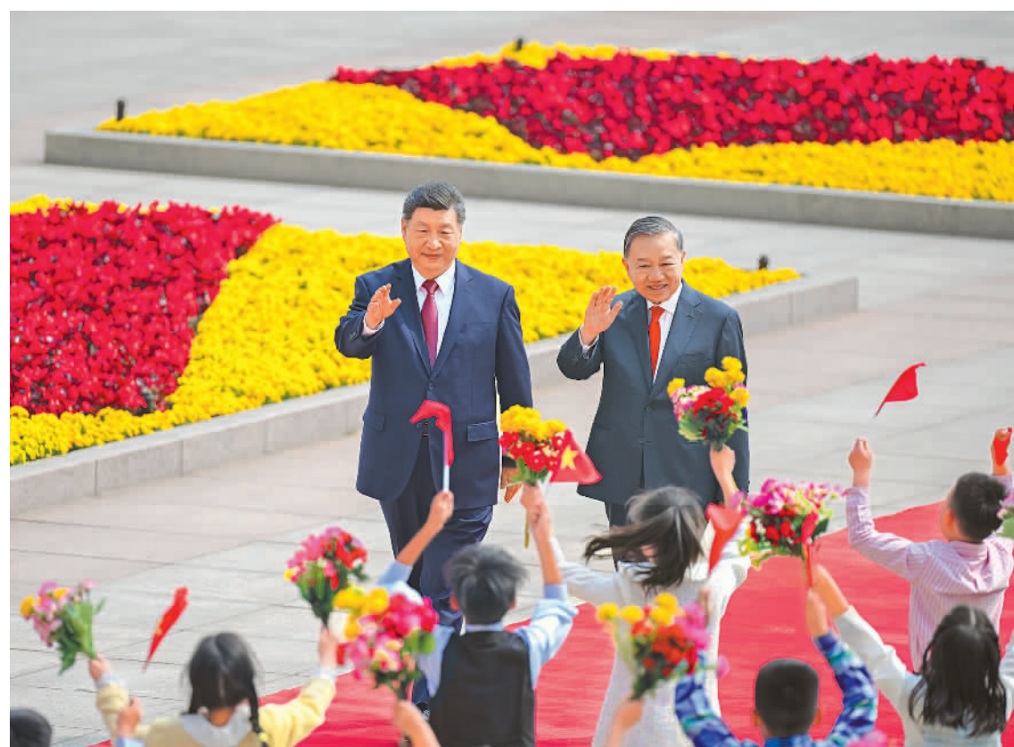
习近平夫妇同苏林夫妇亲切话别 四月十五日 新华社北京4月15日电(记者董雪、冯歆然)4月15日上午,中共中央总书记、国家主席习近平在人民大会堂同来华进行国事访问的越共中央总书记、国家主席苏林举行会谈。 会谈在两国领导人陪同下进行。两国领导人就中越关系、国际形势、双边合作等深入交换意见,达成许多重要共识。 习近平强调,中越两国山水相连、命运与共,两国人民相知相亲、友好往来源远流长。中越两国关系是社会主义国家间的重要关系,也是亚洲乃至世界和平与发展的关键。中方愿同越方一道,推动中越全面战略合作伙伴关系不断向前发展,为构建人类命运共同体作出更大贡献。 苏林表示,越方一贯重视和发展中越友好关系,愿同中方一道,推动中越全面战略合作伙伴关系不断向前发展,为构建人类命运共同体作出更大贡献。 会谈后,两国领导人共同会见参加“红色研学之旅”的中越青年代表,并同他们合影留念。

新华社北京4月15日电(记者冯歆然、董雪)4月15日上午,中共中央总书记、国家主席习近平在人民大会堂同来华进行国事访问的越共中央总书记、国家主席苏林举行会谈。 会谈在两国领导人陪同下进行。两国领导人就中越关系、国际形势、双边合作等深入交换意见,达成许多重要共识。 习近平强调,党的领导是社会主义的最本质特征和最大优势。捍卫社会主义制度和共产党执政地位,是中越两国最大的共同战略利益。双方要保持高度的战略清醒和强大的战略定力,始终坚定道路自信和制度自信,坚持改革不改向、变革不变色。 双方要充分发挥发挥渠道的特殊作用,密切高层交往,巩固政治互信。要用好高层会晤、理论研讨、干部培训、对口交流、地方合作等机制,执行好新一轮中国共产党与越南共产党合作计划,深入开展治党治国理论和经验交流互鉴。要把维护政治安全摆在首位,用好外交、国防、公安“3+3”战略对话机制,持续加强对两国青年一代的理想信念教育。 双方要同心协力,携手同行现代化道路。要加快发展战略对接,优先推进基础设施互联互通。要加强人工智能、半导体、物联网等新兴领域合作。中方欢迎更多越南优质产品进入中国市场。双方要继续加强旅游、文化、媒体、教育、卫生、体育等友好交流合作,促进两国人民相知相亲。我愿同你一道宣布启动2026—2027年“中越旅游合作年”。 双方要高举和平、发展、合作、共赢旗帜,共同反对单边主义、保护主义,维护全球自由贸易体制和产业链供应链稳定畅通。要携手践行全球发展倡议、全球安全倡议、全球文明倡议、全球治理倡议,共同应对全球性挑战。今年是中国—东盟建立全面战略伙伴关系5周年,中方愿同地区国家加强协调和配合,推动构建更加紧密的中国—东盟命运共同体。 苏林表示,这是我当选越南国家主席后首次出访,也正值习近平总书记、国家主席去年对越进行历史性访问一周年,充分反映了总书记同志所说的“邻里越走越亲”。(下转第二版)