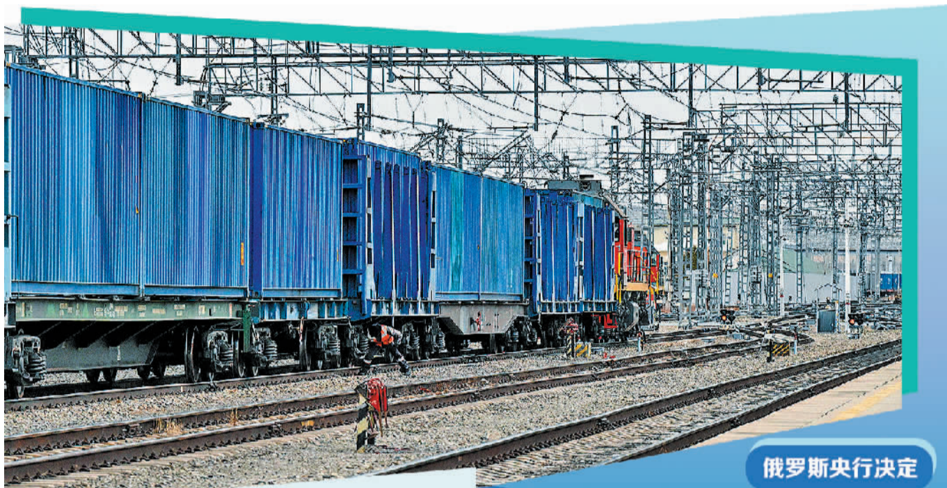
4月22日，在俄罗斯外贝加尔斯克站，工作人员对货运列车进行检查。

稳增长、刺激经济，是推动俄罗斯央行持续降息的核心动因。俄央行正在通胀韧性、经济增长放缓与财政压力之间维持微妙平衡。尽管本次降息释放出宽松信号，但通胀预期与外部环境的不确定性，仍限制着后续政策调整空间。